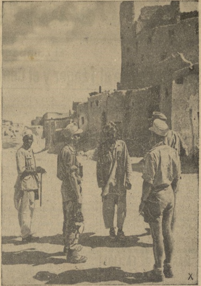
Soldados del Eje conversan con indígenas en el oasis de Siüa

El general en jefe de las fuerzas aéreas italianas que operan en este sector y el jefe de una gran unidad aérea alemana que llegó expresamente en avión para este acto expresó su profunda satisfacción. — EFE.