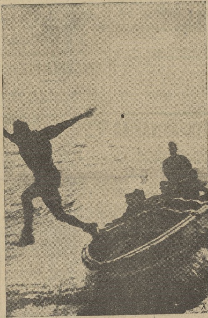
Fuerzas de choque alemanas saltan de sus lanchas para construir una cabeza de puente.

"Este puerto africano — dice el periodista — puede ser peligroso para toda América y para la seguridad de este Continente". — EFE.