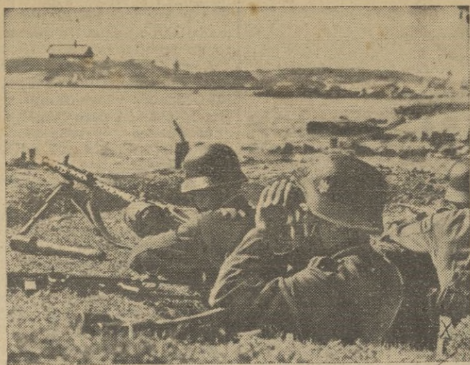
Miles de puestos de observación aseguran el espacio en toda la costa de Noruega.

Frases hondas y todas las pronunciadas son para, como decimos antes, quedar fijadas en muchos como ruta que se traza en el camino. Es, Franco, pues, guión permanente del pueblo que dirige. Y es también, como Caudillo, el jefe que a su palabra precisa y clara, une el ejemplo, crisol en que sabe fundir, seguidas como gran maestro nacional, las enseñanzas que brinda a nosotros los gobernados, sus discípulos de fe.