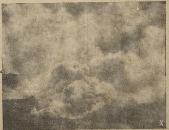
Cargas explosivas y granadas fumíferas caen sobre las posiciones de Stalingrado preparando el asalto definitivo por las fuerzas de choque alemanas.