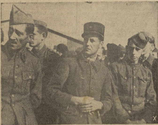
Más de 1.000 prisioneros de guerra del distrito de Dieppe fueron ya repatriados en virtud de la generosa orden del Führer. He aquí un grupo de ellos escuchando una arenga de su oficial.

En la misma conferencia se leyó un mensaje de Roosevelt en el que el presidente prometió que el Gobierno de los Estados Unidos hará todo lo posible para asegurar el reparto equitativo y rápido de víveres entre los consumidores. — EFE.