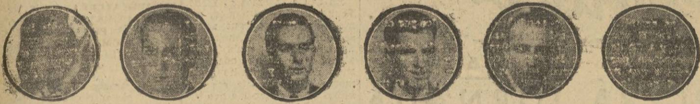
Principales componentes del cuadro gitano que actuó en nuestro festival del pasado día 30