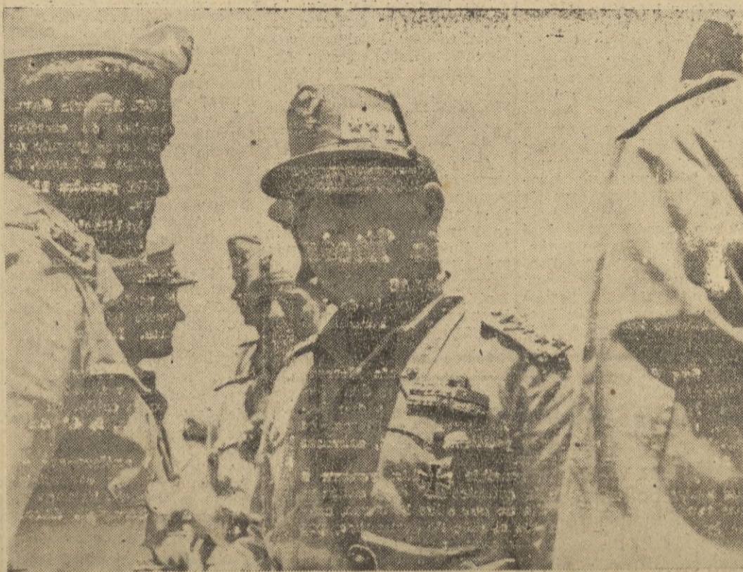
Una reciente fotografía del general Bastico en el frente egipcio.

También la mayor parte de las demás representaciones diplomáticas son esperadas en la capital turca durante la primera parte de octubre. — EFE.