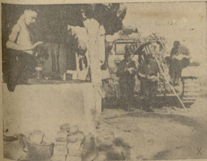
Un alto en el combate de los carros, en la región del Terek.