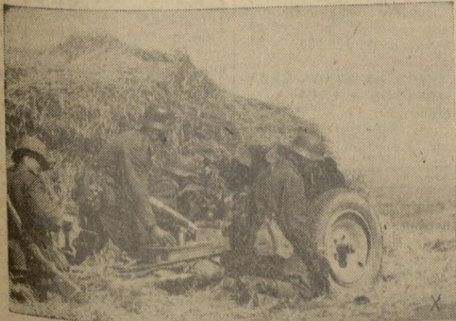
Granaderos tanquistas alemanes esperan un contraataque soviético al Norte de Stalingrado.

Ambos pertenecían a la escuadrilla de García Morato. — CIFRA.