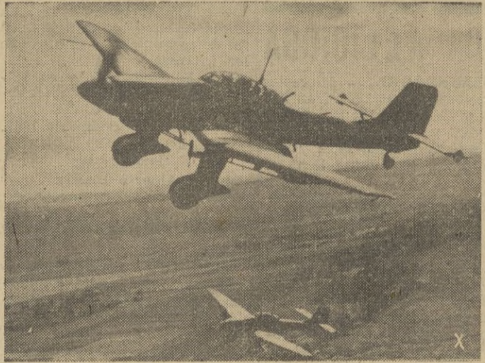
Los "Stukas" atacan una estación soviética en vuelo raso.

Oficiosamente se estima que no llegó el número de muertos a veinte personas en el curso de los ataques alemanes en las horas diurnas de ayer. — EFE.