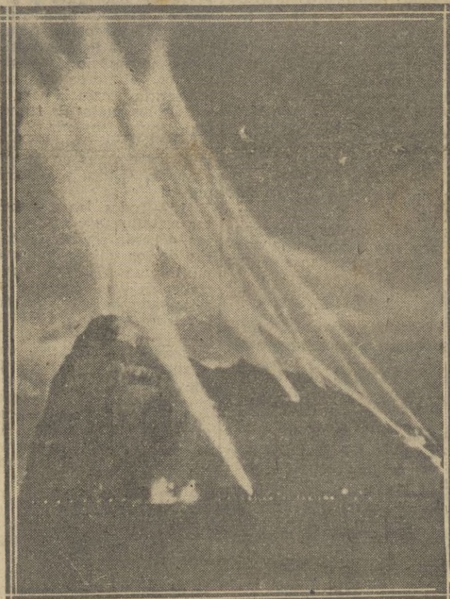
Ya informamos a nuestros lectores del bombardeo que hace tres noches sufrió Gibraltar. Un avión italiano descargó sus bombas sobre el muelle sin lograr ser descubierta por los reflectores de la plaza. En la foto se ven explotar las bombas en el muelle capense.

Con facilidad de palabra el Dr. Boch Marin expone su conferencia, demostrando con datos estadísticos, la ventaja de una política protectora de la infancia para el engrandecimiento de la Patria, hasta que se llegue a lo pronosticado por el Caudillo de llegar a los 40 millones de habitantes que el suelo de España es capaz de alimentar. Demostró que el aumento de la población va aparejado con una mayor moralidad de las cos-