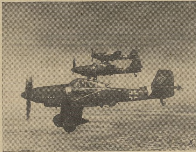
"Stukas" regresan de un bombardeo sobre Stalingrado.