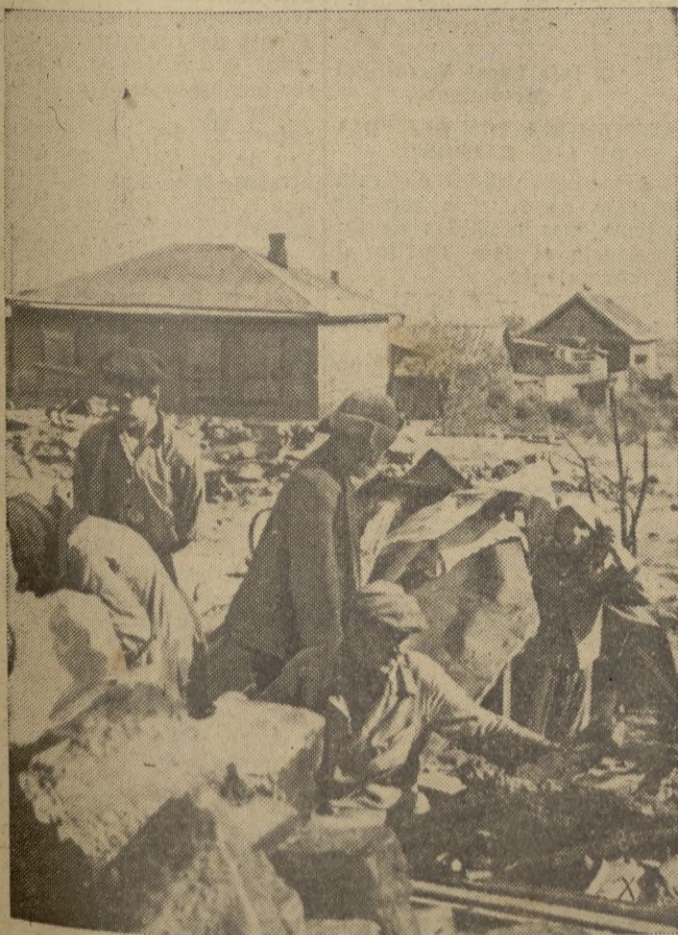
Entre las ruinas de Stalingrado quedan todavía elementos civiles, que viven en refugios subterráneos.

El presidente del Consejo Quisling se ha encargado interinamente de la cartera. — EFE.