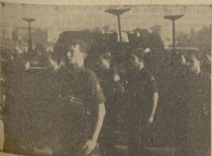
A hombros de la Falange, José Antonio va hacia su tumba etc rna.

Londres, 28. 17. — Smuts ha recibido a Harriman, representante en la capital inglesa de Roosevelt para la ley de préstamos y arriendos y a lord Leathers, ministro británico de transportes de guerra. — EFE.