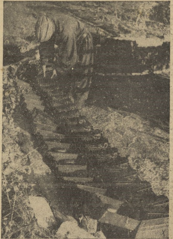
Munición para un antiaéreo alemán de cuatro cañones

Berlin, 28. 23. -- En la lucha por Stalingrado los alemanes han alcanzado el río Volga en otro punto, anuncia el alto mando. Y añade que los infantes han ocupado una gran fábrica de pan en el ba-