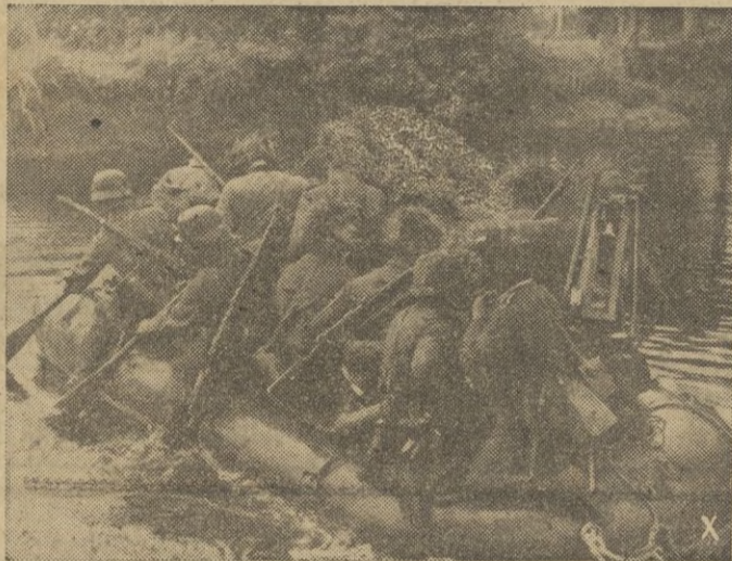
Pontoneros alemanos alcanzan la orilla contraria del Volga inferior para establecer una cabeza de puente.