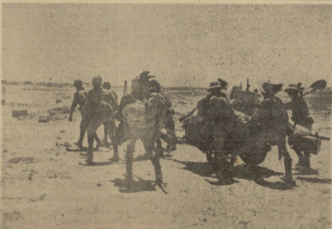
Tropas ligeras italianas en marcha hacia las primeras líneas del frente egipcio.