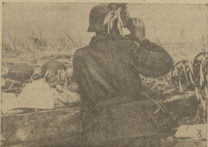
Puesto avanzado alemán en el sector de Stalingrado.