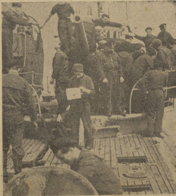
A bordo de un submarino italiano que regresa a su base después de un largo crucero de guerra en el Atlántico, donde ha hundido muchas toneladas de mercantes enemigos