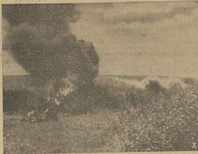
Una sección de lanzallamas húngara limpia la maleza de elementos bolcheviques, francotiradores.

Así la navegación enemiga de abastecimiento ha perdido 15 barcos con un desplazamiento total de 100.925 toneladas. — EFE.