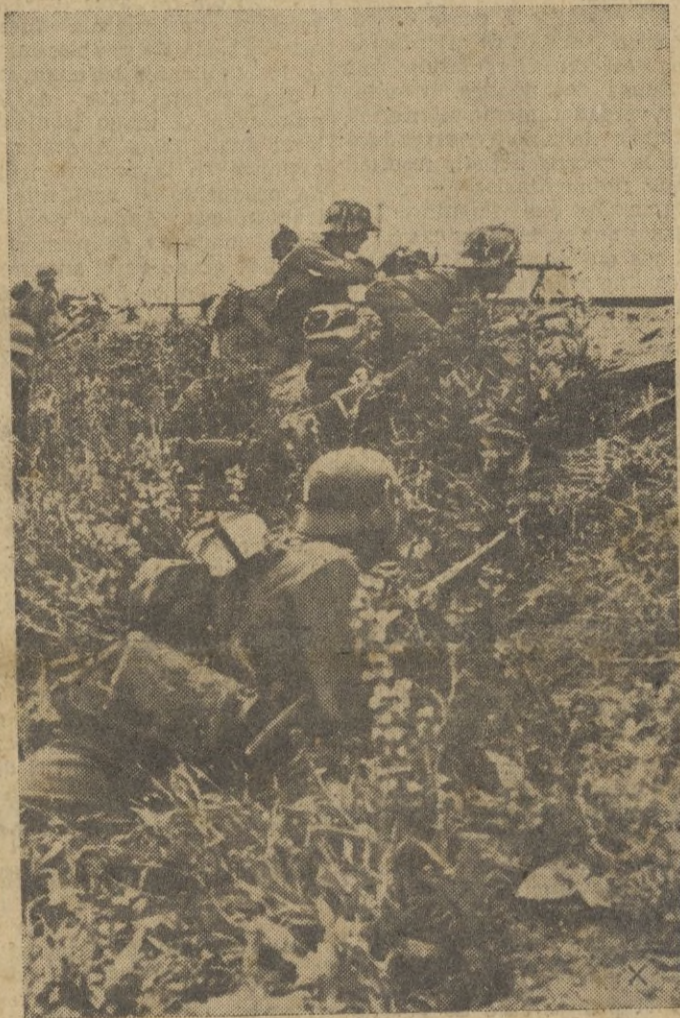
Una sección de ametralladoras alemana defiende la línea férrea que conduce a Stalingrado.

Los Aviones del Reich, desde pequeña altura, disolvieron las concentraciones de carros enemigos dispuestos a atacar las columnas motorizadas alemanas. Veinte carros rusos fueron destruidos y 17 gravemen-