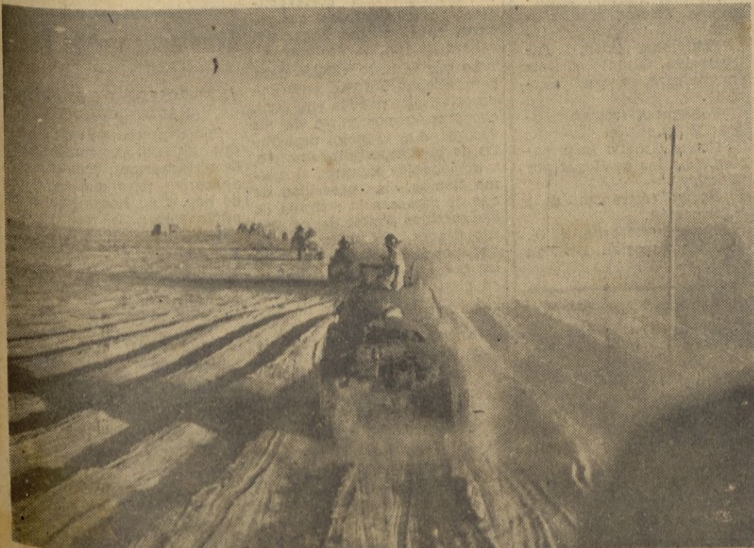
Formaciones acorazadas italianas en movimiento en el frente egipcio.

zado a un fuerte ataque en el sector de Kokoda (Nueva Guinea) con dirección a Port Moresby, según se anuncia en los medios bien informados.—EFE.