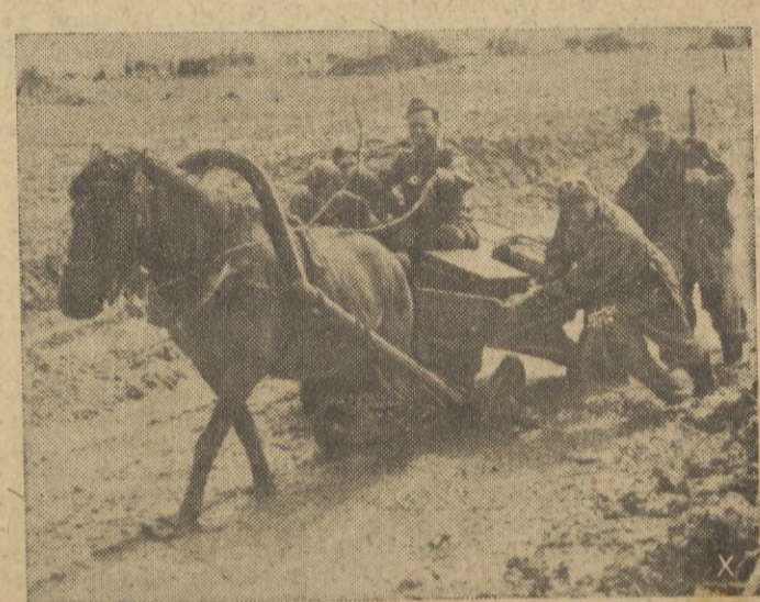
El carro campesino ruso, tal como se usa hace siglos en Rusia, presta buenos servicios en las infinitas tierras del Don.

La organización será realizada en primer lugar por el Departamento de planeamiento del Gabinete. — EFE.