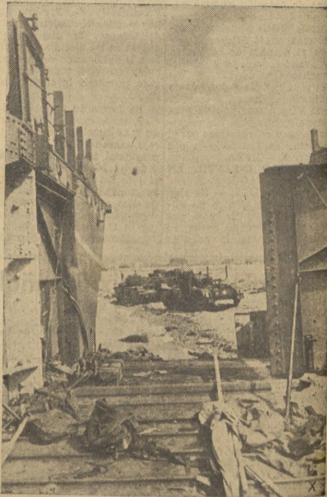
El gran fracaso de Dieppe visto desde un buque de transporte inglés.

Después de las informaciones que han detallado el fracaso británico en la costa del Canal de la Mancha, las cámaras fotográficas van recopilando los detalles más destacados del intento de desembarco frustrado. He aquí un reportaje de aquel hecho de armas: