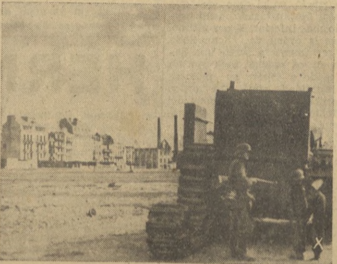
Tanque modernísimo de construcción americana cogido cerca de la playa de Dieppe.

Después de las informaciones que han detallado el fracaso británico en la costa del Canal de la Mancha, las cámaras fotográficas van recopilando los detalles más destacados del intento de desembarco frustrado. He aquí un reportaje de aquel hecho de armas: