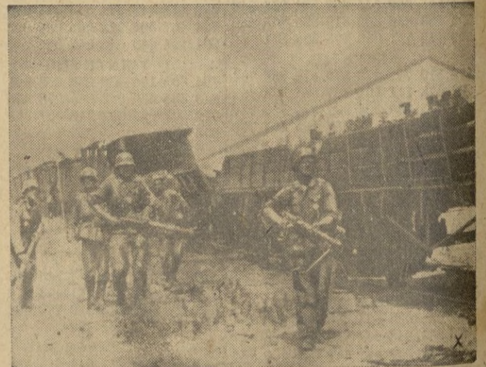
Acaba de tomarse una estación en la línea que conduce a Stalingrado. Patrullas alemanas limpian los vagones de bolcheviques escondidos.

Formaciones de "Stukas" fueron atacadas por nuestros aviones y obligadas a desprenderse de sus bombas. Seis bombarderos y cinco cazas enemigos fueron destruidos y más de 12 averiados. — EFE.