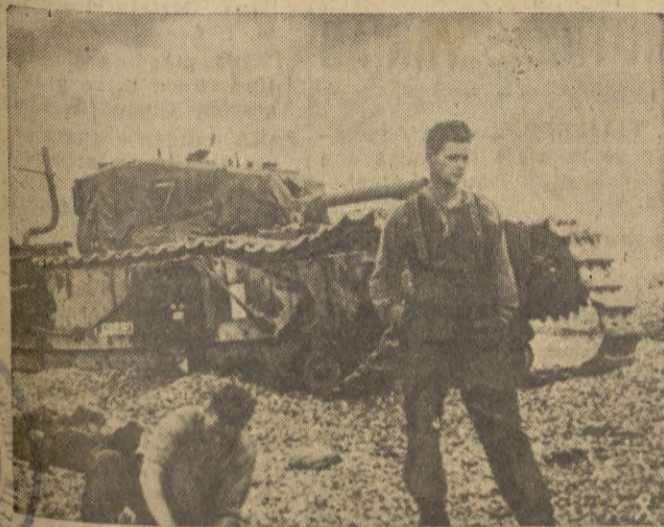
DESPUES DEL FRACASO DE DIEPPE. -- Algo de lo que los "invasores" tuvieron que abandonar en las playas francesas.

Londres, 2. 23.30. — El comité ejecutivo del grupo laborista inglés ha anunciado que en el futuro mantendrá la decisión adoptada en la conferencia para no colaborar con el Partido comunista inglés, por considerar que éste apoya el esfuerzo bélico de la Gran Bretaña no por amor a la Patria sino por el interés de Rusia.—EFE.