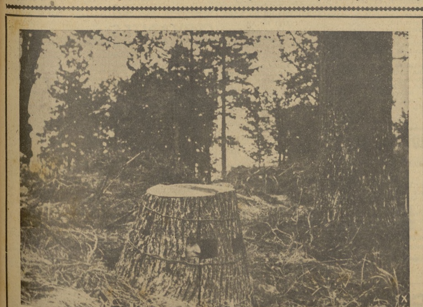
Los rusos son verdaderos maestros en construir refugios y fortines. He aquí un puesto de observación imitando un tronco de árbol y que ahora sirve a las fuerzas alemanas

El glorioso caído pertenecía a la Acción Católica de Durango.