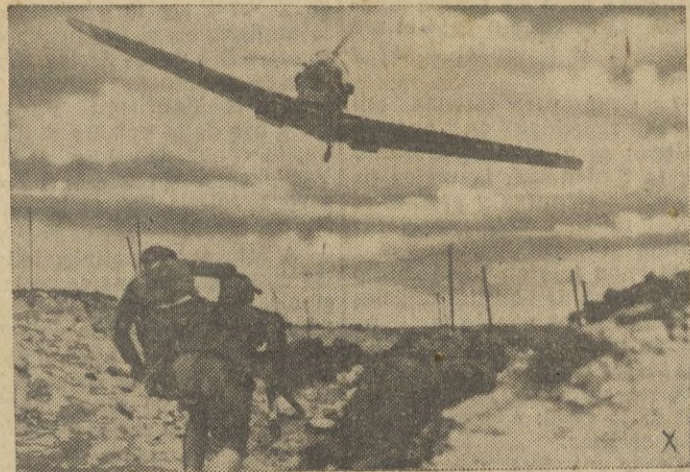
Aviones de combate alemanes atacan en vuelo rasante una trinchera enemiga

Año IX.- Núm. 2.454 | Ceuta, Domingo 13 de Septiembre de 1942 | Ejemplar: 25 cts.