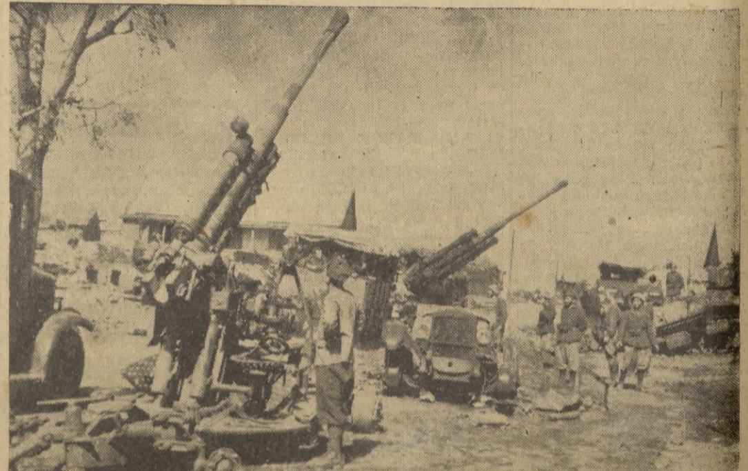
Artillería rusa destruida por las tropas italianas en la región del Don.

Tal es la gravedad de la situación para los soviets que toda la población civil de Stalingrado ha sido incorporada a las armas. Sobre la dureza de la lucha un corresponsal yanqui ha dicho a su periódico que toda la zona de combate es un horno gigantesco. El diario moscovita "Pravda" dice en relación con la lucha, lo siguiente: