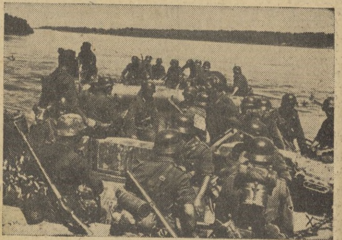
Poderosos grupos de ejército pasan el Don para marchar al sector de Stalingrado.

Mientras en las llanuras de Stalingrado luchan los germanos en un clima de fuego, tropas especialistas en la guerra de montaña han coronado el pico más alto de Europa: el Elbrús. El primero que escaló la cumbre fué el capitán alpinista Heinz Grotn. Lleno de gozo escaló la cima, luchando con la tormenta y con los tiradores enemigos. Ha subido