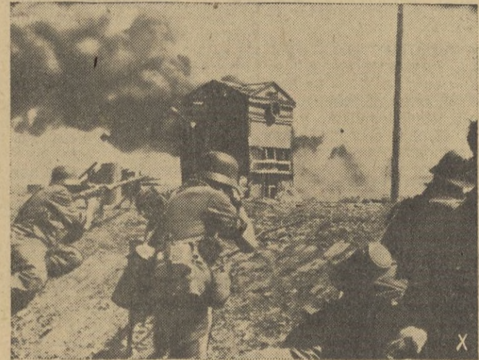
Fuerzas de choque liquidan la última resistencia soviética en esta aldea.

materialmente destruida por las fuerzas en lucha, señala uno de los campos de batalla más duros de toda la campaña en Rusia. Dos millones de hombres participan en esta lucha. En Berlín se ha afirmado que la batalla de Stalingrado ha sido la más violenta y en la que han participado más tropas y masas de material desde que comenzó la guerra. La ciudad, en la cual han penetrado ya los dispositivos del Ejército germano, en forma de cuña, vivió en días pasados una de sus horas más angustiosas, cuando 150 bombarderos alemanes se lanzaron simultáneamente contra los objetivos de la plaza, causando tremendos daños. Stalingrado es hoy un tremendo mar de llamas, porque las fuerzas no bastan para apagar los incendios que se han propagado por todas partes.