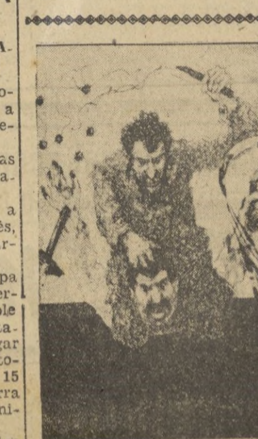
Ya una vez atravesamos con toda felicidad el mar Rojo y ahora debemos repetir la suerte otra vez

De lo Rodríguez se retiró en el pueblo de Benifa por padecer dolores de estómago. — CIFRA.