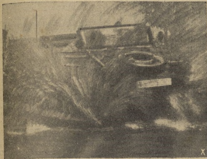
El coche popular alemán presta excelentes servicios en los caminos encenagados de las estepas rusas

Los depósitos combustibles están a punto de agotarse y la producción nacional obtenida especialmente en Zuldak no basta para el consumo nacional. -Efe.