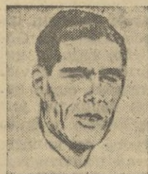
Una vez más, Prensa y público se deshace en comentarios elogiosos hacia este gran equipo, hoy por hoy uno de los más calificados de la Península y a quien, esa racha de mala suerte que tanto suele perseguir a los onces futbolísticos, ha privado de conquistar los últimos títulos nacionales. Una vez más se reconoce que es superior a cuantos —también pertenecientes a la División de Honor— le precedieron en su actuación. Y una vez más supera a todos ellos en cuanto a clase y en cuanto al resultado obtenido.