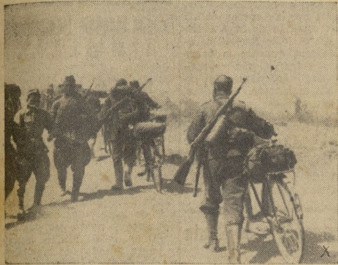
Avance hacia Stalingrado.

Berlin, 18, 2,15 m. — Según informan los círculos militares de la capital del Reich, existen dos factores importantes que retardan la definitiva caída de Stalingrado.