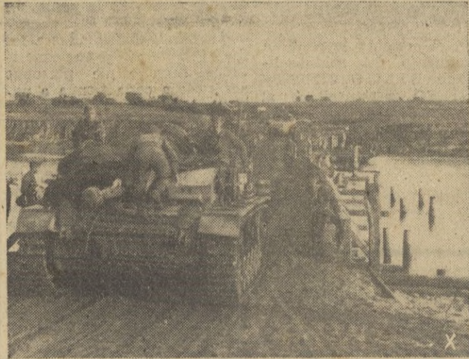
Artillería motorizada alemana pasa el Don cerca de Voronej para rechazar un ataque rojo.

Las tropas francesas continúan oponiendo resistencia. — EFE.