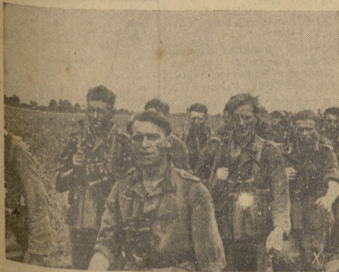
Las canciones de la patria lejana acompañan la infantería alemana en sus marchas interminables a través de la estepa.