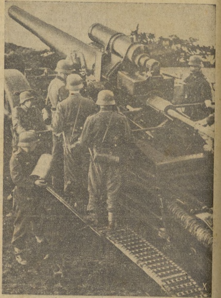
Una batería pesada alemana de guardia costera en el litoral de Noruega.

En la noche del 23 al 24 nuestras patrullas se mostraron activas.