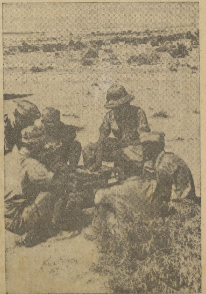
TRANQUILIDAD EN EL FRENTE EGIPCIO. -- Centinelas del Eje pasan el tiempo con juegos de naipes.