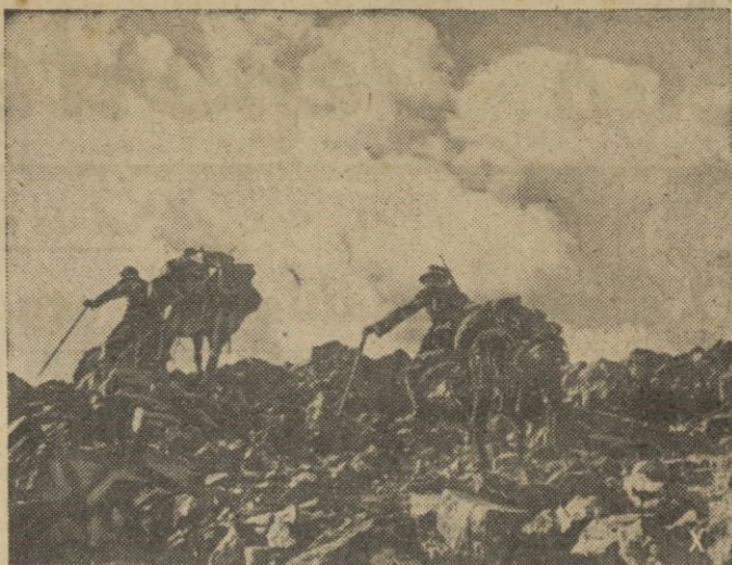
Cazadores alpinos alemanes con sus mulas, ambos acostumbrados a estos paisajes, persiguen al enemigo por encima de los picos más elevados del Cáucaso.

Esta es, ni más ni menos — y con ello lo digo todo — la tarea que ha de pesar sobre vosotros. Es indudable que la técnica y las Ciencias actuales van recogiendo los resultados de la experiencia y nos señalan constantemente nuevas normas, nuevas formas del decir y del enseñar, y, sin embargo, para mí todo eso es tan elemental y simple que toda la Pedagogía, absolutamente toda, se condensa en esta cualidad que debe ser excelsa, del maestro: despertar la atención del niño, excitar su curiosidad, hacer amena la enseñanza y que las explicaciones más que respondiendo a un cuestionario del maestro respondan única y exclusivamente a la curiosidad infantil, al cuestionario que este mismo formule. Esta es la atención y resultado máximo a que debe aspirar un maestro. Después de esto — que al fin y al cabo no es otra cosa que llevar a vuestro conocimiento lo que en el soldado y en el oficial significa toda su pedagogía para formar el alma del soldado, llevándolo vosotros al maestro poco queda que decirnos que no se haya dicho ya: fraternidad entre los dos pueblos, ambiente para formar una enseñanza. El maestro nacional en España, es un español más; el maestro nacional en Marruecos es el español que más destaca y al