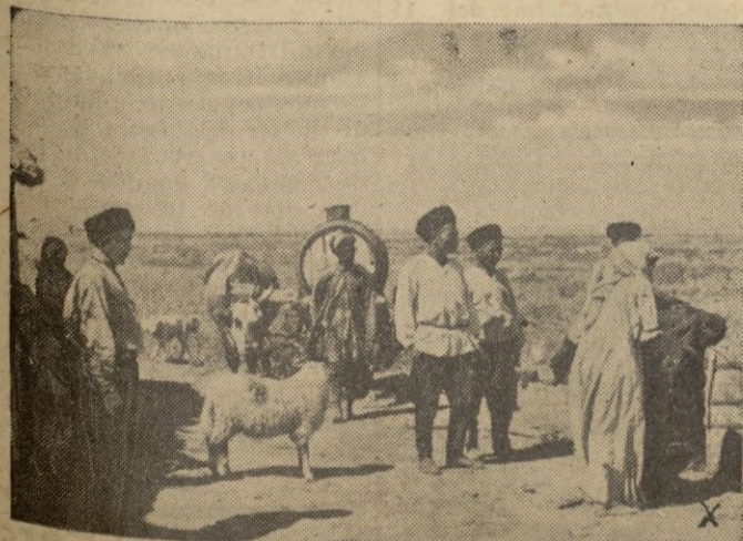
En su avance hacia el Cáucaso, las tropas anti-bolchevistas pasan ya por los pueblos habitados por tártaros de pura raza.

No deje de ver nuestra sección de ANUNCIOS BREVES.