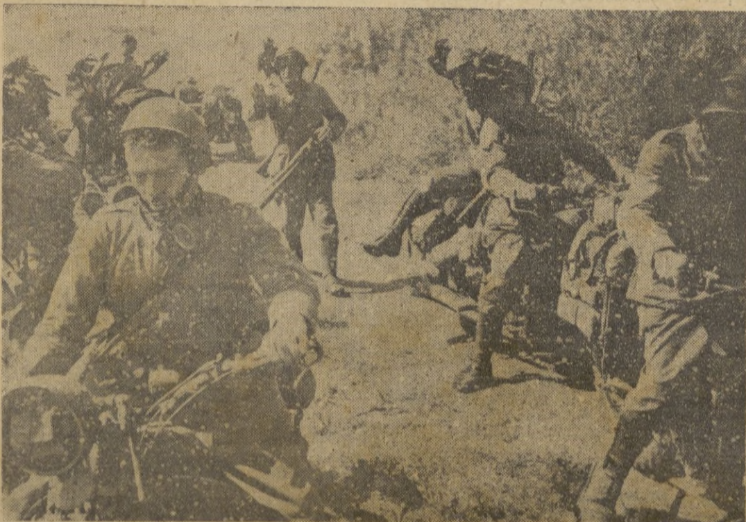
"Bersaglieri" motociclistas italianos en el frente ruso.

En vista de que las bombas cayeron cerca del submarino lográndosele hacer averías se supone que el submarino enemigo fuera hundido. — EFE.