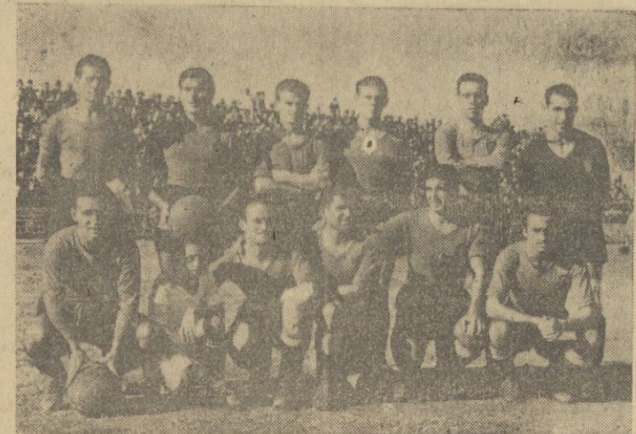
El once ceutí que esta tarde disputará los dos primeros puntos del torneo al potente Málaga.

que a muchos causó desesperación, esta tarde va a congregarse toda una afición en nuestro estadio de Jadú. No para ver un partido amistoso más, en el que la caballerosidad y las buenas costumbres superen en mucho al juego desarrollado y a las emociones vividas al calor de un interés difícil de narrar. No. La afición ceutí y marroquí va a concentrarse esta tarde en el estadio "Alfonso Murube" para algo más que para eso. Va a darse cita allí para, sin menospreciar esa caballerosidad y nobleza que es patrimonio del mejor de los deportes, presenciar una lucha pródiga en bellas jugadas y en emociones; una lucha en la que el tesón, el ardor y el entusias-