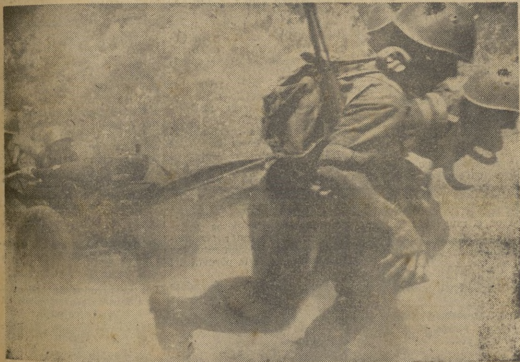
Tropas alpinas de la Armada italiana en Rusia en marcha hacia nuevas posiciones.

Barcelona, 26. 17. — Un artístico album con firmas de todos los ex-cautivos será ofrecido al Generalísimo Franco, según se ha dado cuenta esta tarde durante la sesión primera del Congreso Nacional de Ex-cautivos. — CIFRA.