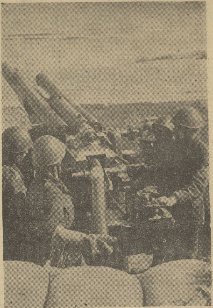
Artillería de la defensa costera de Tobruk en acción