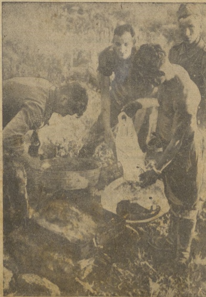
Los cocineros de una división alemana preparan un plato exquisito con peces del río Sal.