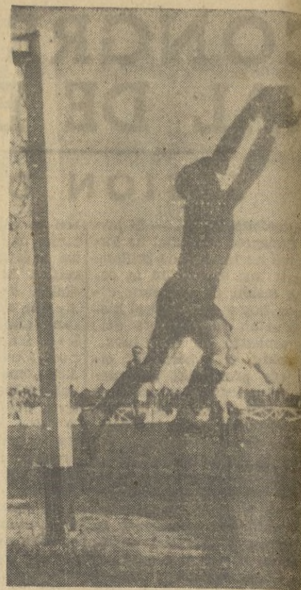
Una magnífica parada del guardameta malagueño