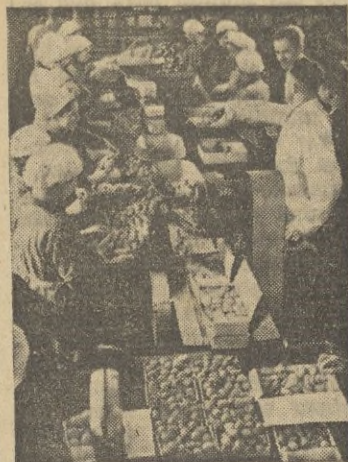
La preparación de fruta para ser congelada.

bres y frutas se realiza empaquetándolas, después de un escaldado rápido, en pequeñas cajas, que se envuelven en papel celofán perfectamente pegado.