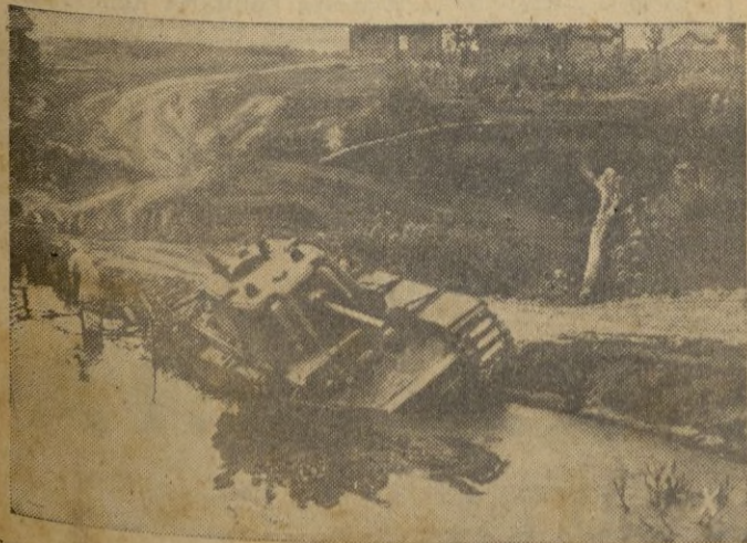
En un vano ataque contra las líneas alemanas, este tanque soviético encontró su fin en un arroyo.