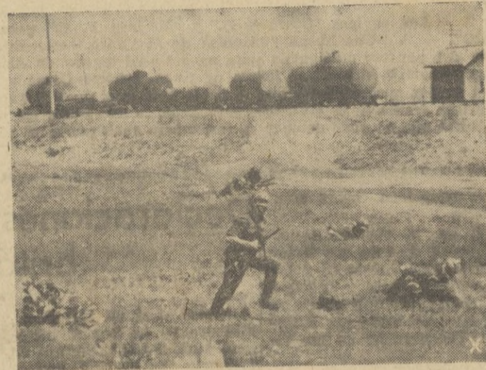
Al lado de los ejércitos alemanes casi todas las naciones europeas luchan contra el comunismo. — Tropas húngaras asaltan una estación de ferrocarril defendida por los bolcheviques.

encima de los asaltantes alemanes mezclándose con el concierto sordo de los lanza-salvas soviéticos. Durante el día, la Luftwaffe alemana domina completamente el cielo de Stalingrado, son pocos los bombarderos y aviones de combate soviéticos que se atreven a salir al frente. Pero durante la noche, los motores bolcheviques zumban y susurran en el cielo, y el horizonte está rojo ante el resplandor de las bombas en explosión y del fuego de los incendios en la estepa.