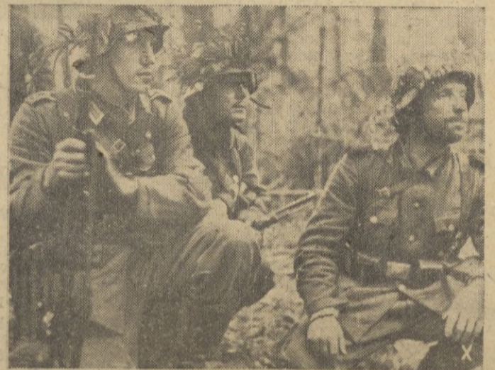
En intensa atención, los hombres de un grupo de choque alemán observan los efectos obtenidos con un lanzamiento antes de emprender al ataque.

vision comunista china, mandada por el general Lygiug, así como otros cinco mil chinos más. — EFE