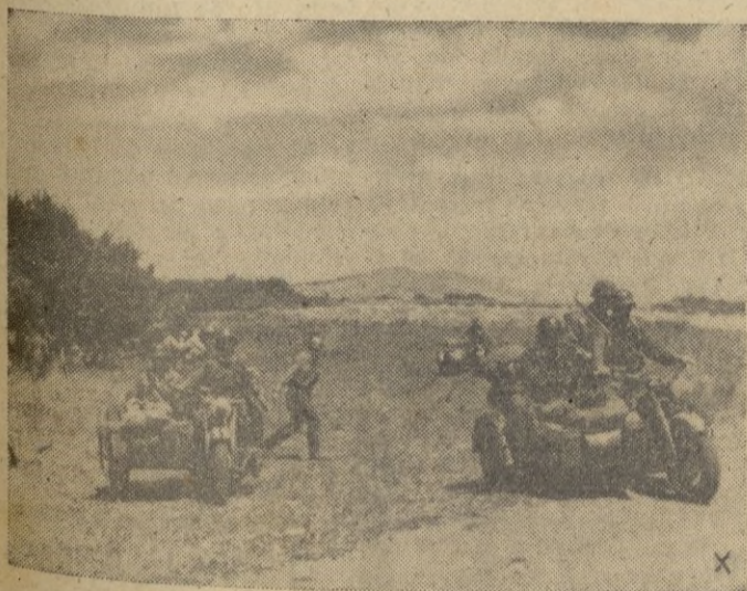
Una formación motorizada avanza rápidamente en el terreno montañoso del ante-Cáucaso.

Quince aviones bolcheviques fueron derribados en combates aéreos. — EFE.