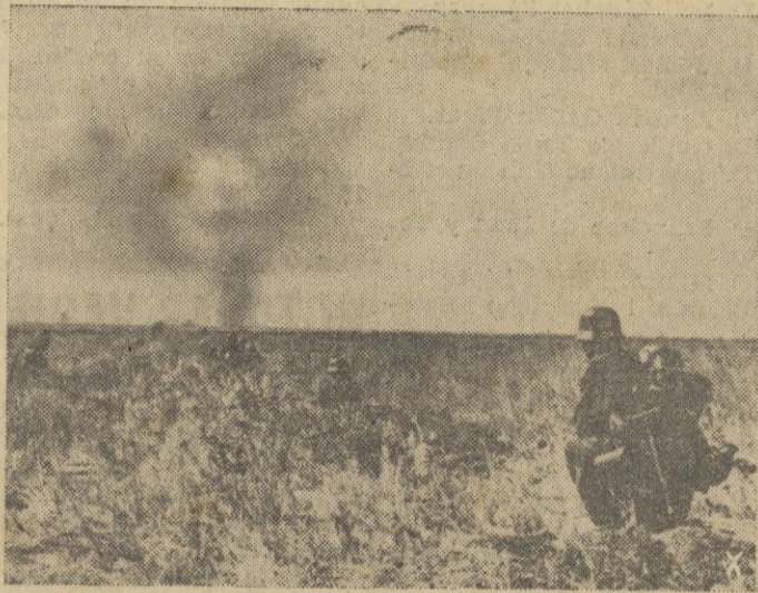
Bajo el fuego protector de la artillería avanza un grupo de infantería alemana. Una escena del frente de Stalingrado.