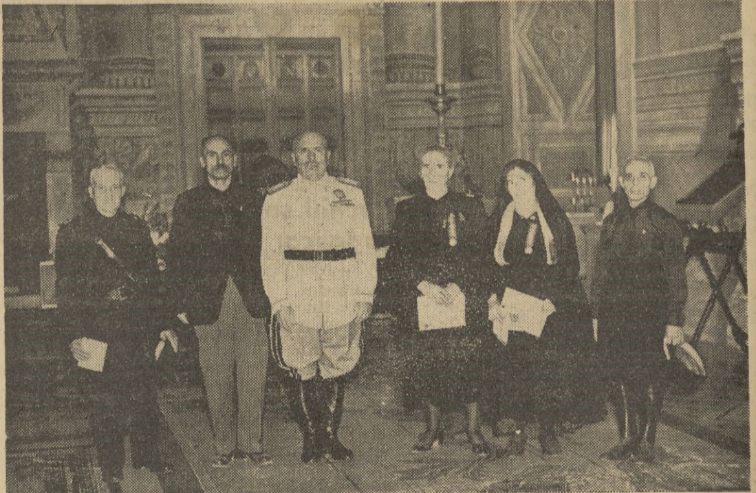
El Duce recibe en el "Palacio Venecia" a los cinco cabezas de familia vencedores del concurso de las familias que tienen mayor número de hijos bajo las armas.

Añadió que todos los informes que solicita el enviado de Roosevelt le serán facilitados por las autoridades chinas. — EFE.