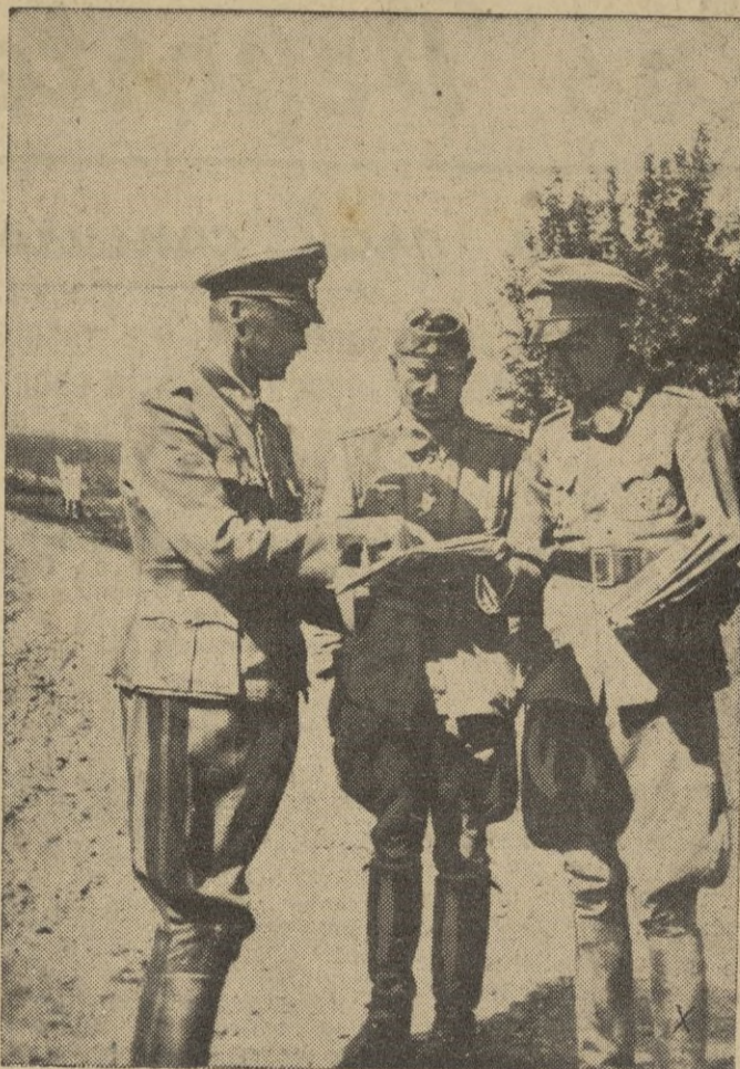
El General Herr, laureado comandante jefe de una división alemana, consulta el mapa de la región en que ha de dirigir otro ataque contra los rojos.

Nanking, 29. 20. — Toda la China celebra hoy el 2494 cumpleaños de Confucio. Por este motivo el presidente del Estado, Wang-Cring-Wei ha pronunciado un discurso diciendo que el gran antiguo sabio y estadista chino fué un hombre de importancia trascendental, no solamente para su patria, sino para toda Asia