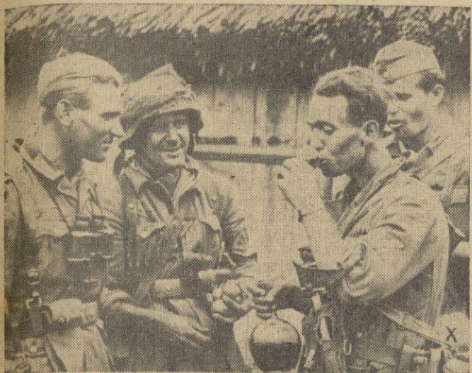
El enemigo se retiró del pueblo. Antes de emprender la persecución, estos soldados alemanes se permiten un pequeño descanso y un buen trago de la botella.