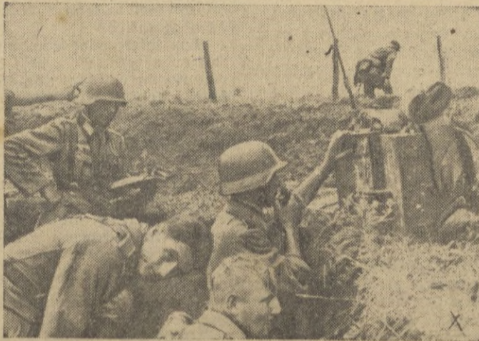
Hasta en las líneas más avanzadas, el telegrafista tiene que cumplir su misión difícil de quedar en comunicación constante con todos los puestos de mando de su sector

En medio de los gritos de "Banai" alejóse acompañado por el entusiasmo de los camaradas marinos de guerra alemanes, que cantaban ambos los himnos de las naciones amigas. — EFE.