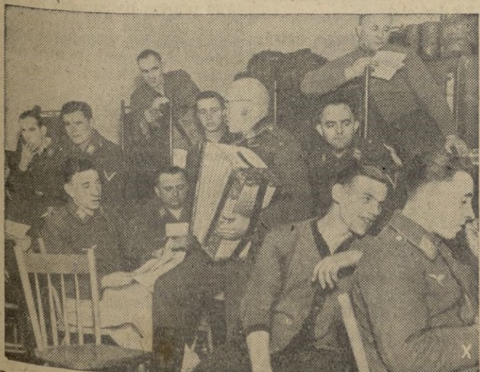
Los automovilistas, d. un. columna d. transporte, d. scan-san de su largo viaje en una ciudad rusa, próxima al frente de combate.