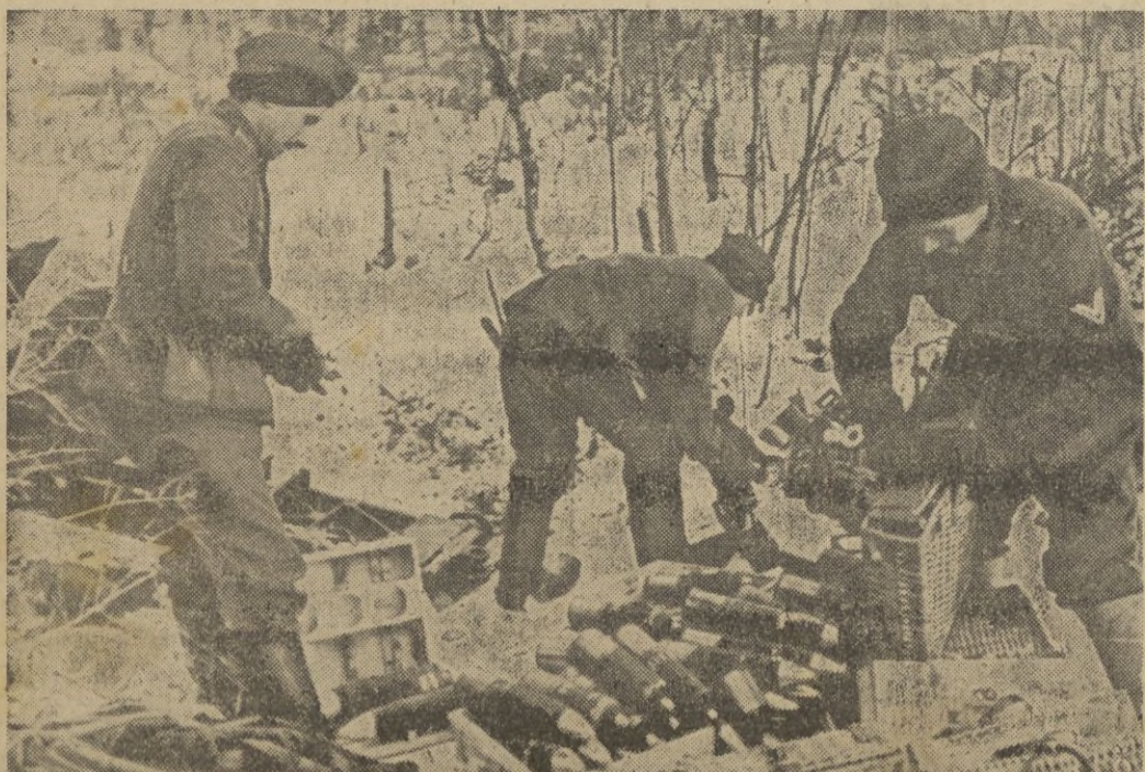
En un intervalo del fuego, los artilleros preparan nuevas muniones para la batería, a fin de reanudar el duro combate.

Industria y Comercio. — Se dispone que las plantillas de Ingenieros ayudantes de minas en los distritos mineros sean provisionalmente los siguientes: Tenerife dos y Las Palmas dos y dos. — CIFRA.