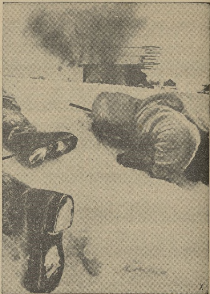
Mientras la artillería soviética dispara todavía, los granaderos se preparan para lanzarse al asalto de las líneas bolcheviques.