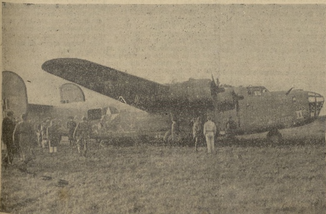
Un cuatrimotor americano del tipo "Consolidated Liberator" obligado a aterrizar en territorio italiano.