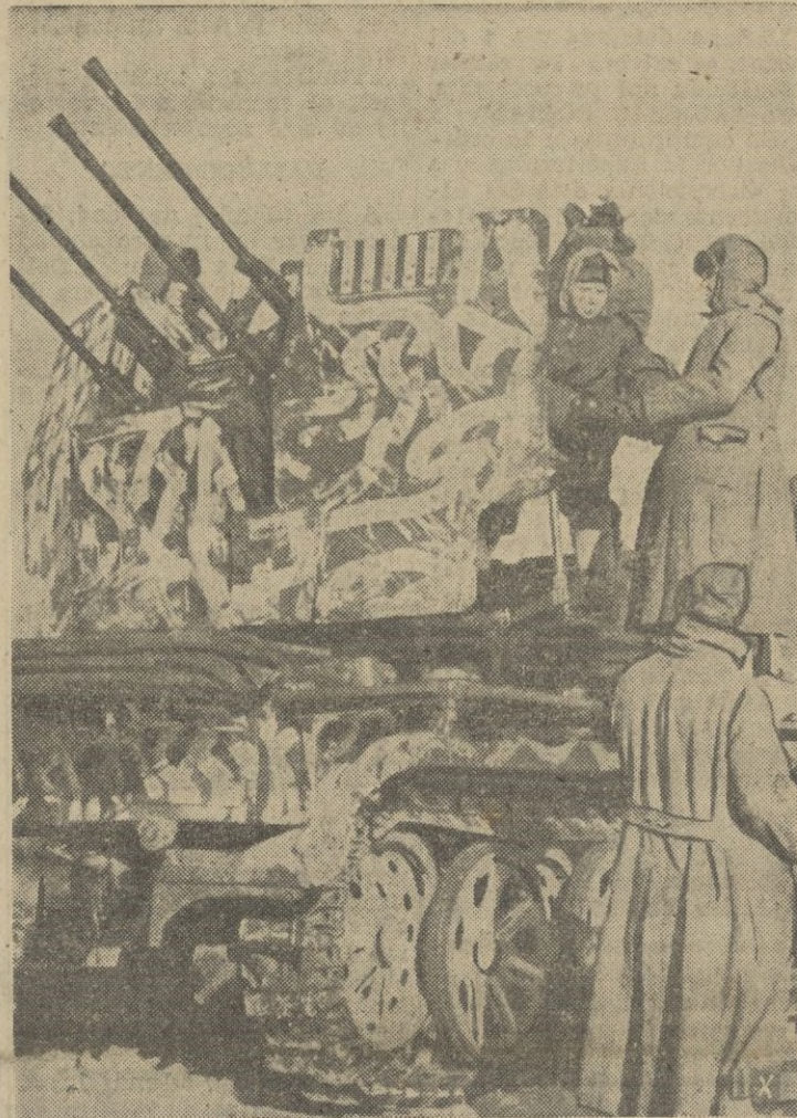
La artillería antiaérea, con cañones de cuatro tubos combate incansable en la etsepa. Las rayas marcadas sobre el cañón señalan los aviones soviéticos derribados.