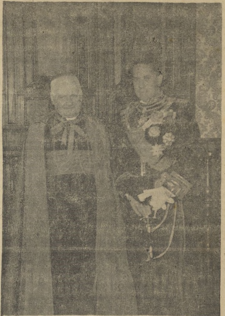
El cardenal Maglione devuelve la visita al conde Galeazzo Ciano, después de la presentación de las cartas credenciales al Santo Padre.