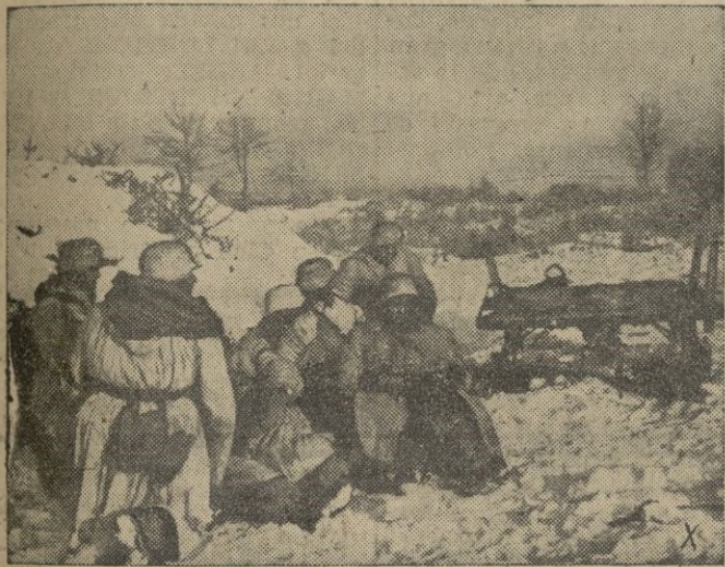
Los granaderos alemanes esperan en sus posiciones provisionales la orden de ataque