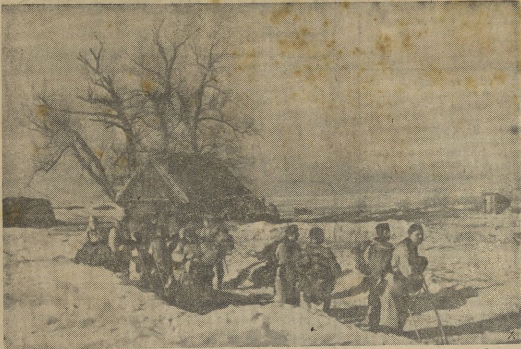
Una compañía de soldados alemanes se prepara para marchar a una nueva zona de combate