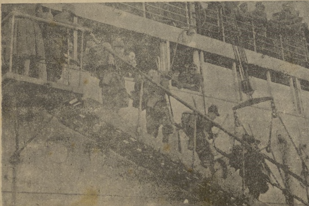
Las tropas italianas desembarcan en un puerto de Túnez.