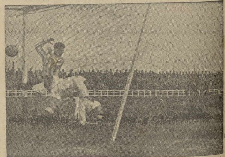
El único tanto ceutí. Abad mata valientemente un balón centrado por Morla.