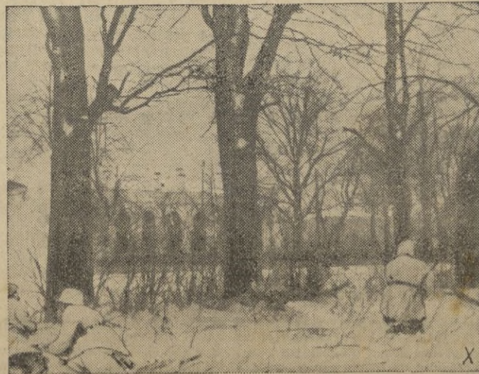
Granaderos alemanes se aproximan con cautela a una estación rusa para tomarla por asalto desde una posición favorable.