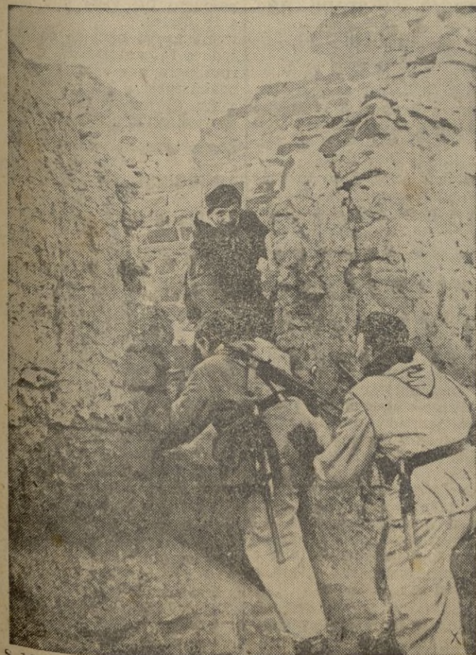
Italianos alemanes se disponen a rellevar a sus camaradas en una población soviética destruida