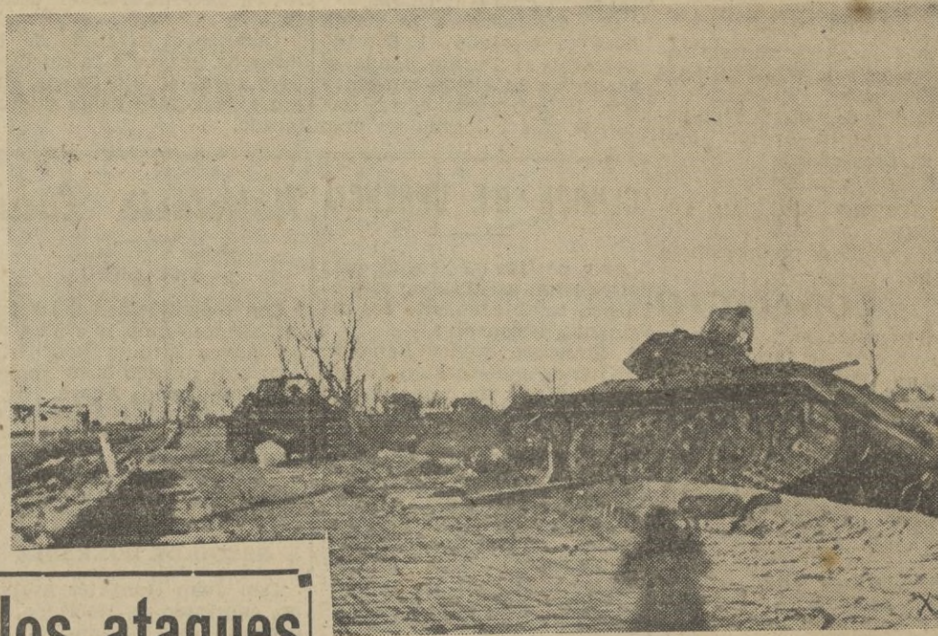
Tanques bolcheviques destruidos al borde de la carretera por donde avanzan los alemanes