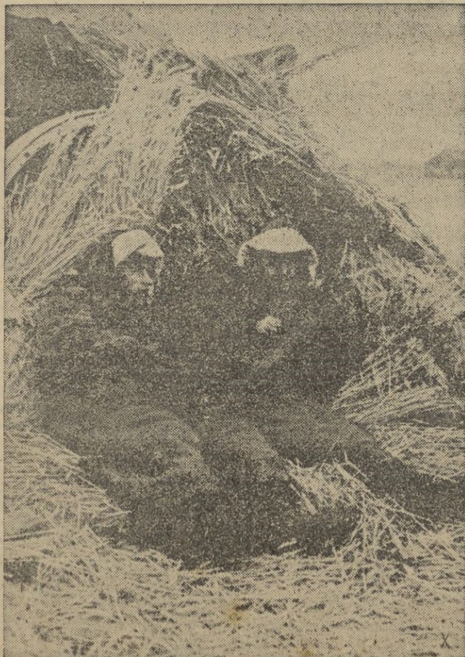
Los artilleros de una batería que interviene en los duros combates al este de Jarkov descansan arrimados a su arma camuflada.