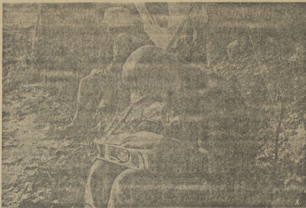
Durante un intervalo del fuego, este soldado escribe una carta a su familia. Una caja de municiones sirve como escritorio.