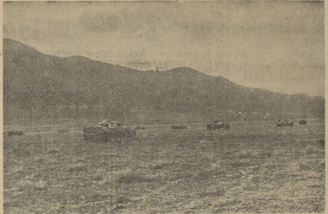
Tanques alemanes en las planicies de Túnez.

Madrid, 8. — El Boletín Oficial del Estado publicará mañana un decreto del Ministerio del Ejército, por el que se nombra general jefe de las fuerzas de tierra, mar y aire, en Canarias, al capitán general de dicho archipiélago don Francisco García Escamez e Hiniesta. — CIFRA.