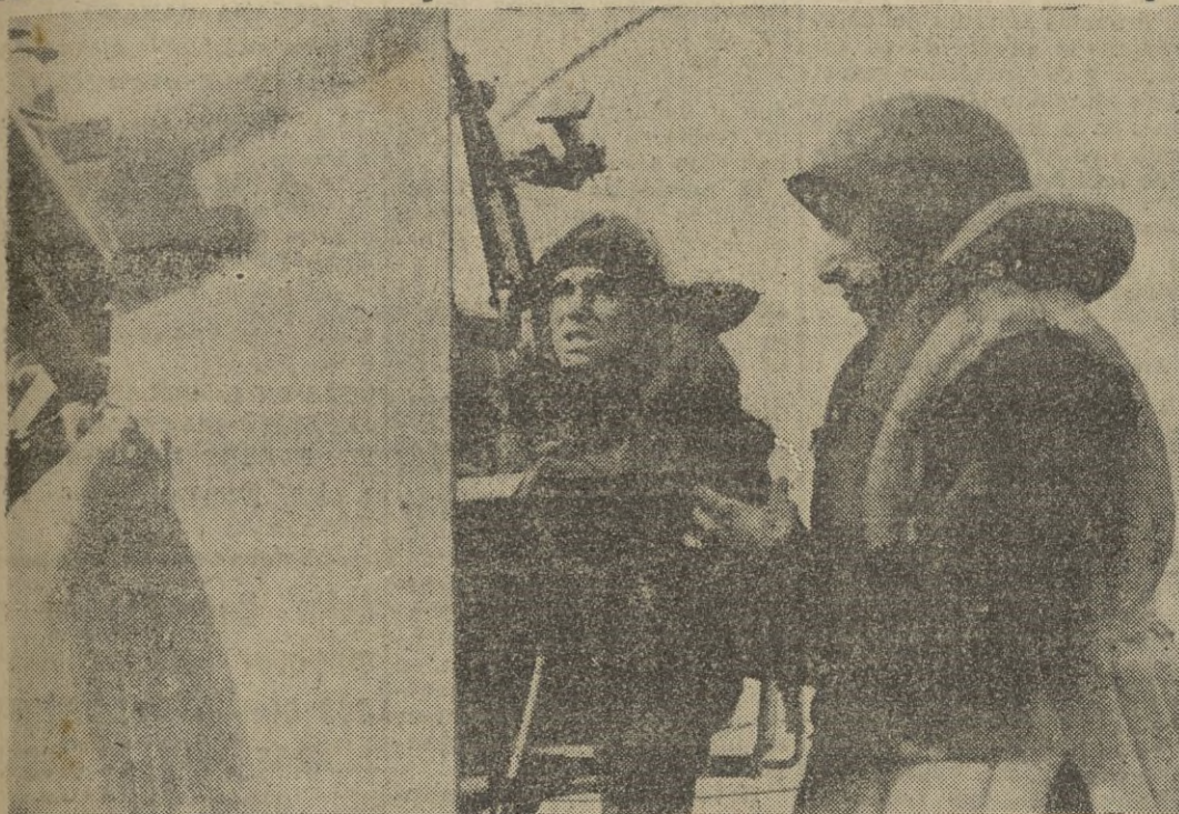
A bordo de un buque de guerra italiano que escolta a un convoy se hace fuego contra aviones enemigos