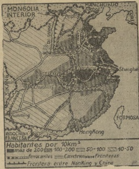
Habitantes por 10km 2 más de 200 100-200 50-100 10-50 Ferrocarriles Carreteras Fronteras Frontera entre Nankín y China

China es un país de espacios enormes. El Japón, en el curso que sus largos años de lucha sobre el suelo chino se ha limitado a ocupar y a organizar las partes más importantes de este gigantesco territorio. Desde el punto de vista de superficie el Gobierno de Nankín administra un territorio chino que no comprende más que un tercio de toda la China. Pero este territorio tiene más del 5 por 100 o sea unos 300 millones de chinos, mientras que el territorio regido por Chungking a excepción del valle superior de Yang Tsé y de algunas bandas orientales de terreno se encuentra muy poco poblado. Lo mismo