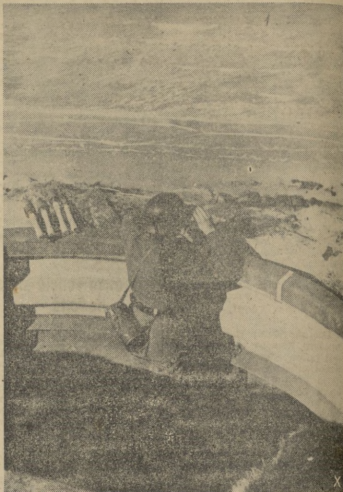
Cuando los primeros rayos del sol, calientan el puesto de guardia permanente contra el enemigo, el centinela alemán, otea con interés el horizonte