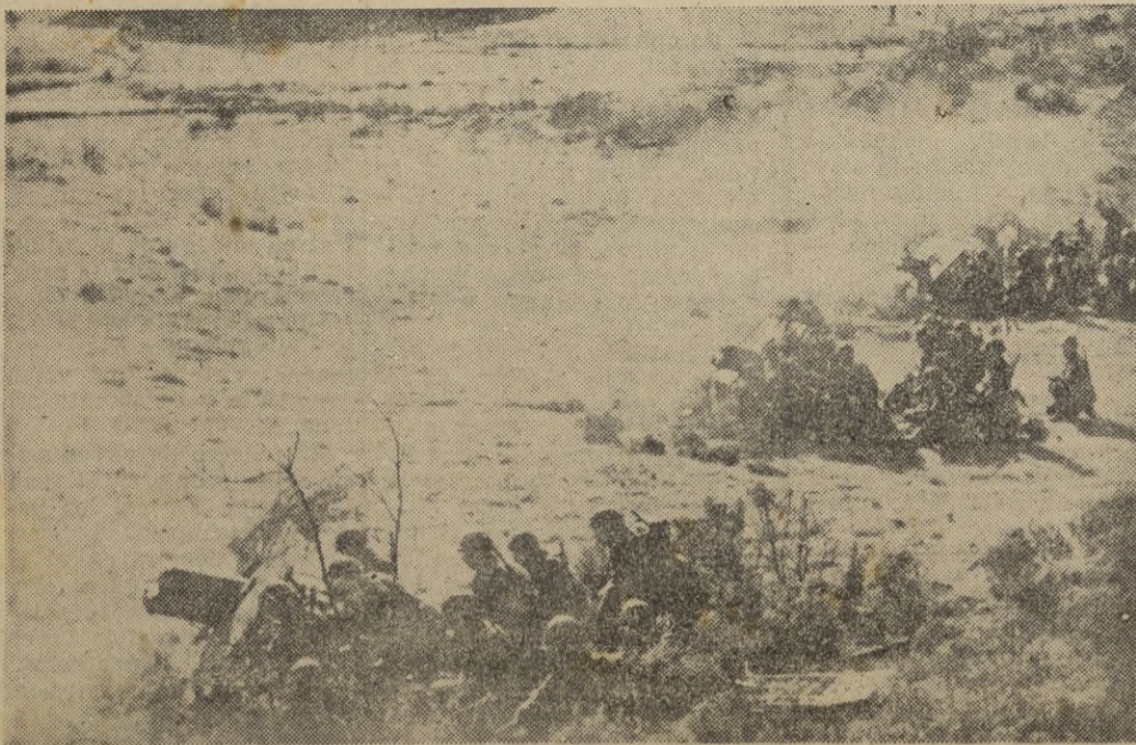
Artillería italiana ligera preparada para entrar en acción en el frente de Túnez.