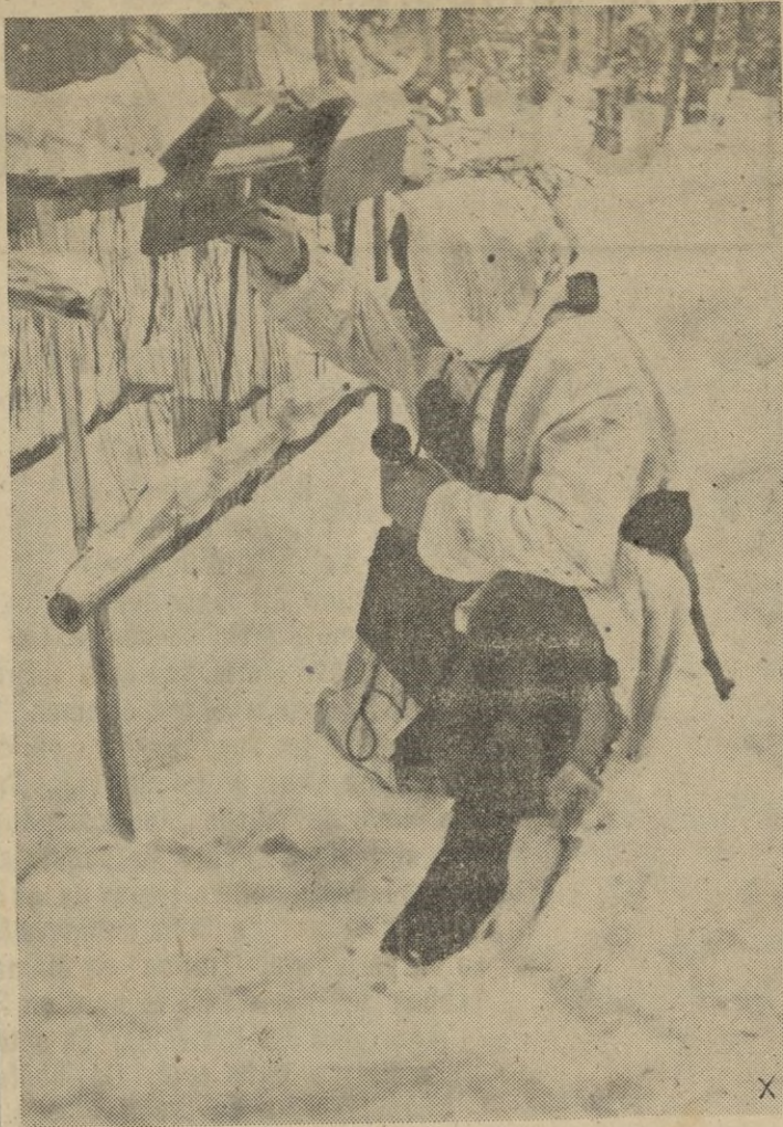
Después de intenso trabajo el jefe del grupo conecta los hilos que se dirigen en todas direcciones

to, con motivo del primer aniversario de la muerte de su padre.