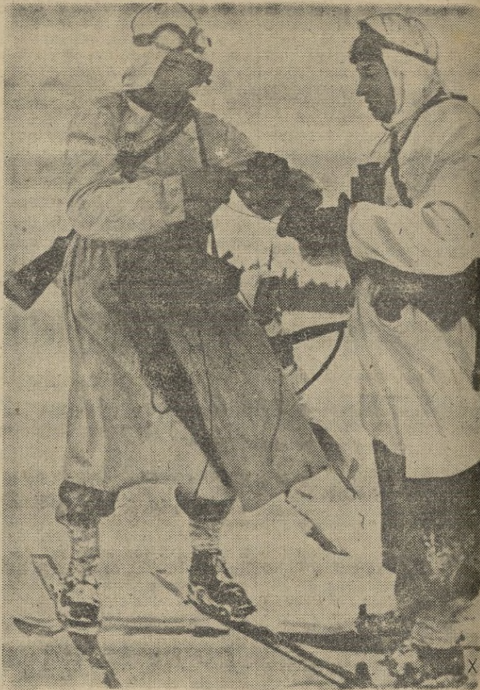
Los dos extremos del hilo telefónico quedan unidos en la este pa