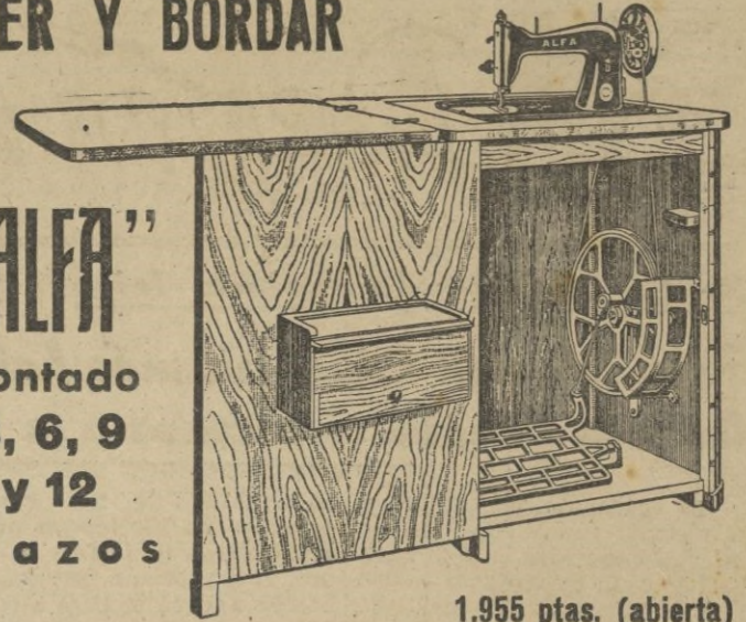
1.955 ptas. (abierta)