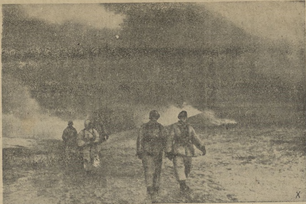
Un pueblo ocupado en un contraataque después de una dura resistencia en la zona Sur de Orel es consumido por las llamas. Las nubes negras de humo contrastan con la nieve blanca.