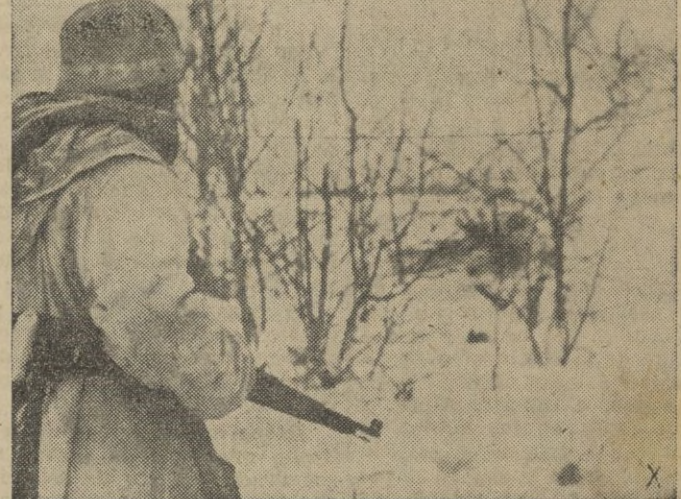
Mientras la primavera ha hecho ya su entrada en el frente Sur ruso, en el del Norte reinan todavía el frío y la nieve.