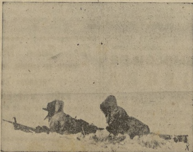
En una posición "erizo" alemana al SE. de Jarkov.