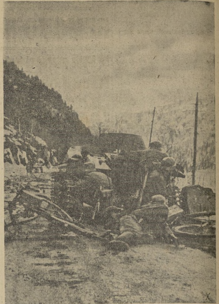
Fuerzas motorizadas alemanas, en la entrada de una población, luchan con los guerrilleros soviéticos

merosos arcos de triunfo con alegóricas inscripciones de agradecimiento.