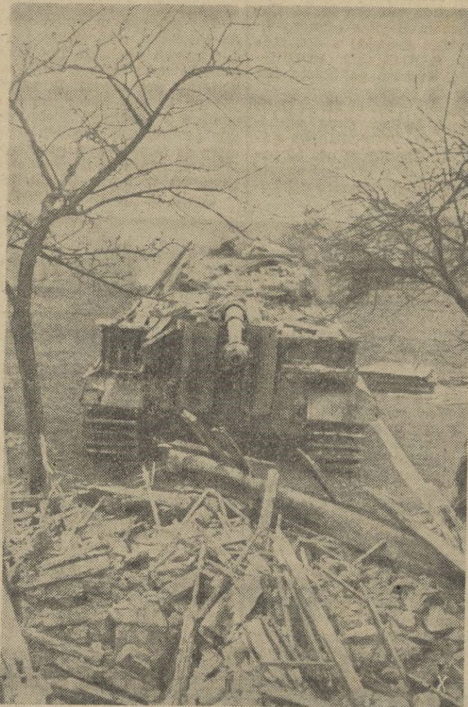
El nuevo tanque alemán el "Tigre" supera todos los obstáculos, sin esfuerzo y sin dificultad. El muro de una casa, queda completamente derruido al paso del tanque de nueva creación