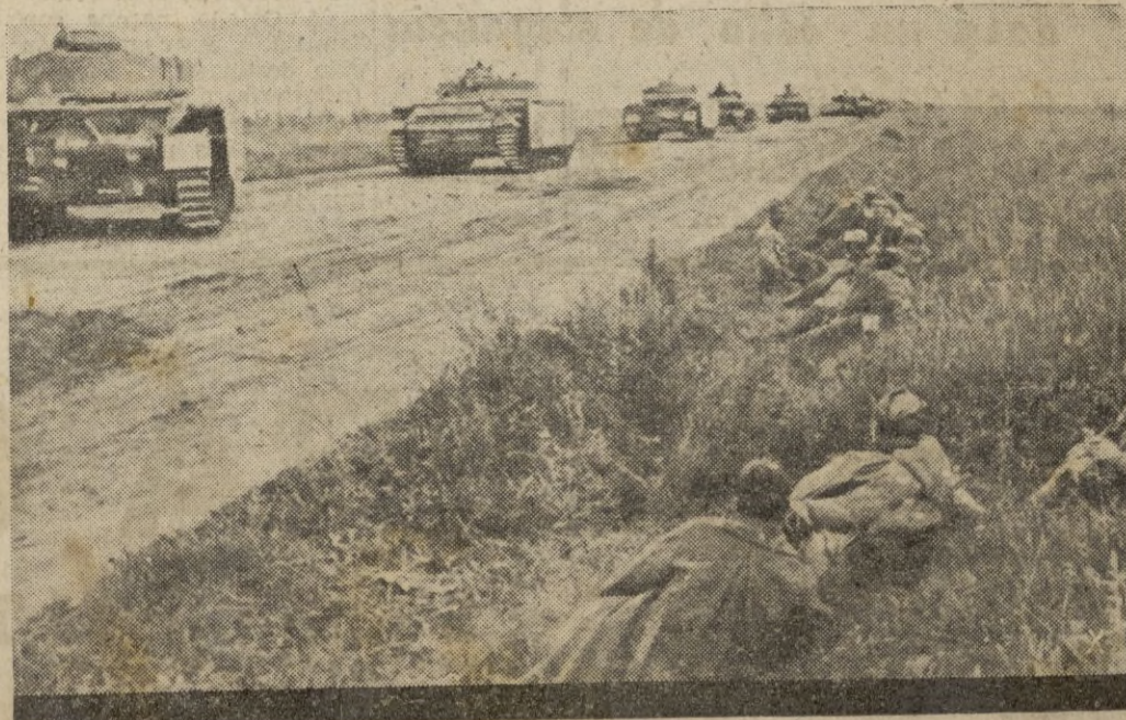
Tanques pesados alemanes avanzan en dirección al frente.