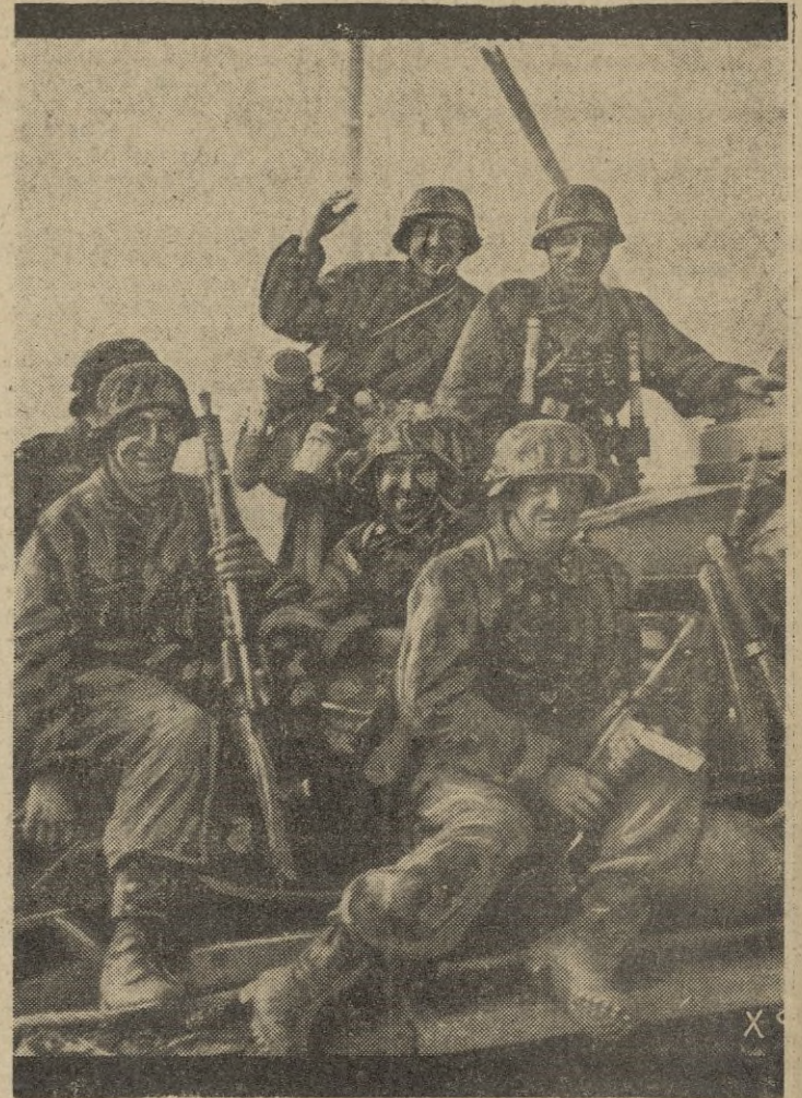
Nuevos e incesantes refuerzos afluyen a las líneas de combate del Este. La juventud de Europa, la mejor juventud, se apresta a la batalla. He aquí un sonriente grupo de granaderos alemanes a bordo de un tanque "Tigre".