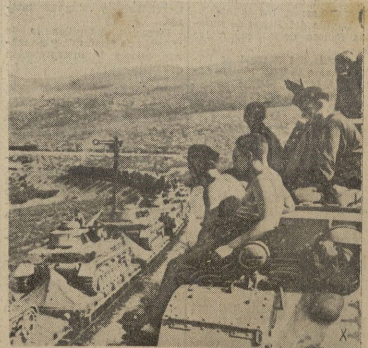
En muchos puntos del litoral europeo pueden verse con frecuencia estas escenas: columnas de tanques en marcha paralelas al mar por donde puede surgir el peligro.