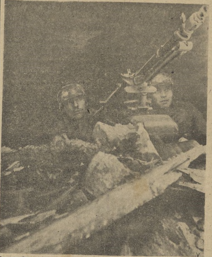
La moderna ametralladora marca en el cielo del frente los puntos suspensivos de su tableteo. Los aviones enemigos se acercan a la trinchera.