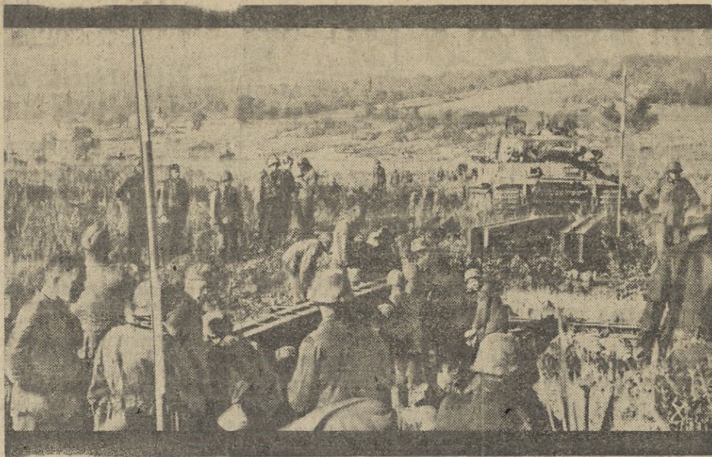
De vez en cuando las unidades de las "panzers", se retiran a retaguardia, después de dura lucha y los tanques son revisados y puestos otra vez a punto