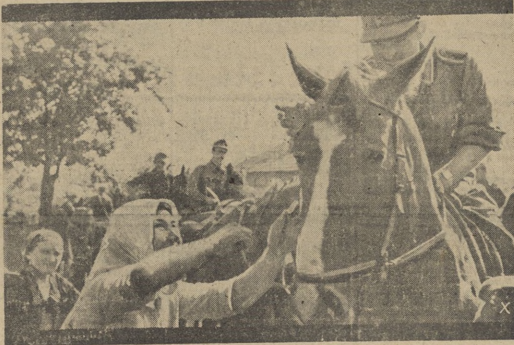
Los soldados alemanes, al pasar por los pueblos rusos, liberados del terror bolchevique, son agasajados por la población civil