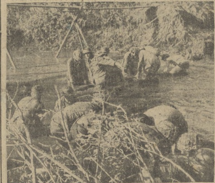
Zapadores alemanes preparan el paso del río para el avance de los tanques