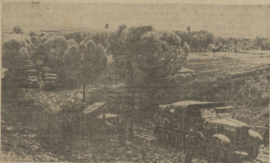
Un día de lluvia basta para enlodar completamente las carreteras. Las columnas de abastecimiento, alemanas, se sirven de los tractores para hacer avanzar los vehículos y que no se interrumpa el servicio.