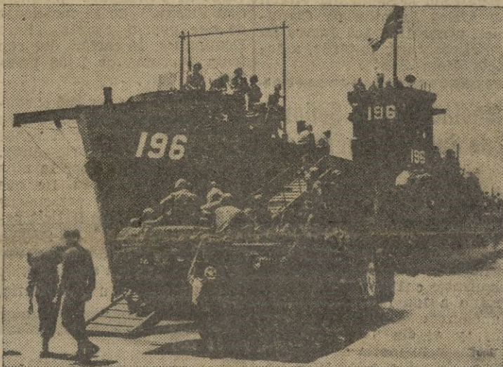
Un camión anfíbio norteamericano, recogiendo la carga de provisiones de una unidad de desembarco en el frente italiano