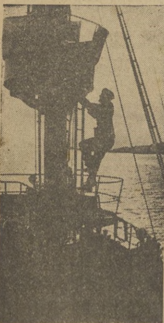
El cazasubmarino alemán del servicio en el Mar del Norte.