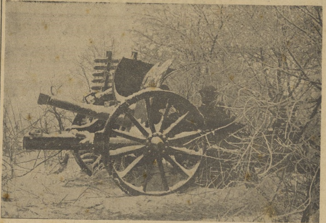
Un cañón italiano emplazado en el Don.