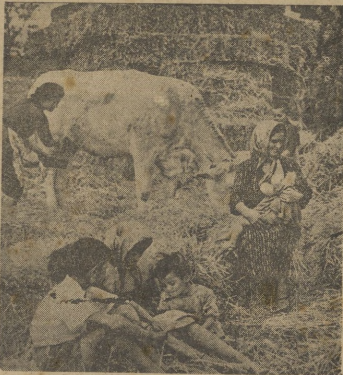
He aquí tres generaciones de una familia de antiguos colonos en Túnez.