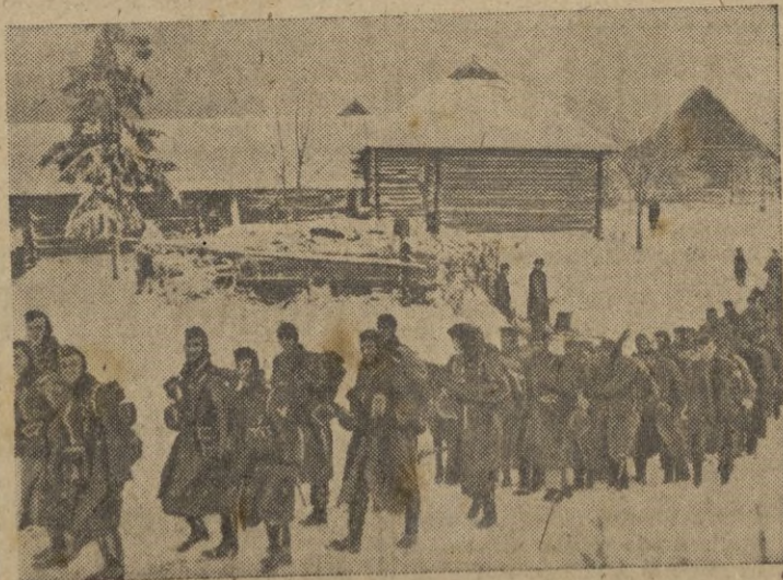
El destacamento marcha sobre la nieve, hacia las primeras líneas para hacer el relevo.

Los bolcheviques no desisten de sus violentos ataques, siendo aniquilados en todas partes