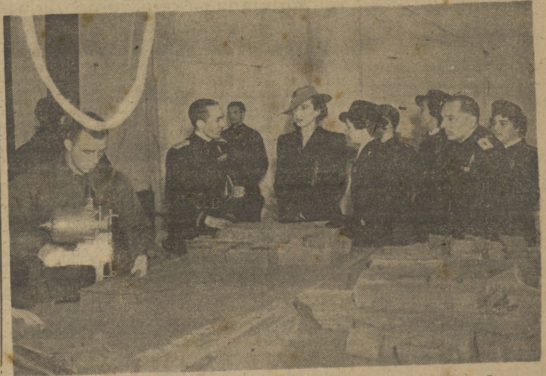
S. A. R. la Princesa de Piemonte visita un centro del partido donde se preparan los paquetes de invierno para los combatientes.