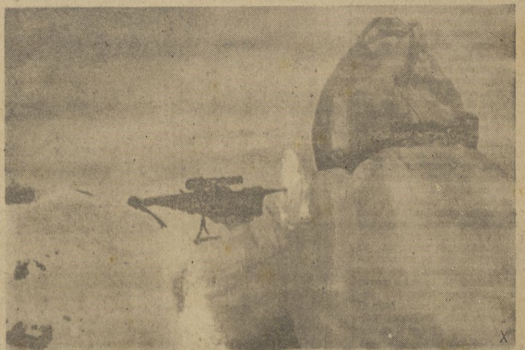
El tirador germano, apretado horas y horas contra su fusil "Iwan", con telescopio de puntería, espera impasible el momento de que su tiro sea mortal.