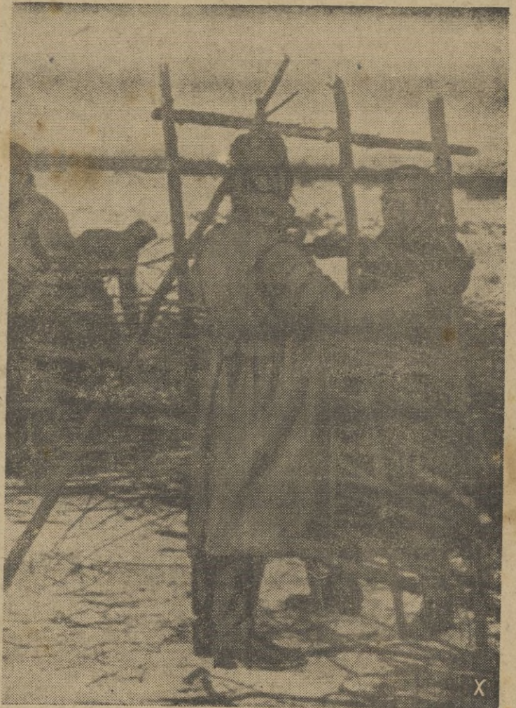
Los caminos del frente hay que cubrirlos con ramaje para ocultar a la vista del enemigo el paso de las tropas, por la inmensa estepa