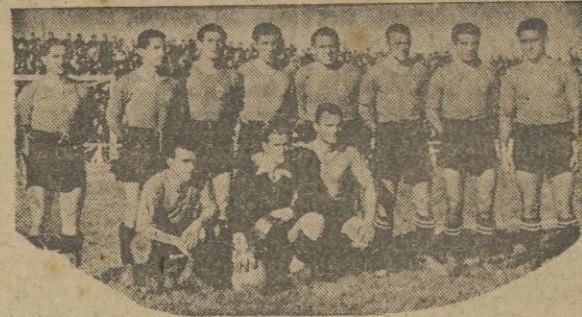
El "Real Murcia" que esta tarde actúa en nuestro estadio. Aquí aparece con su alineación en su última actuación en Ceuta.

El campeón juega esta tarde con un "Real Murcia" que necesita la victoria, para asegurar su permanencia en la Segunda División