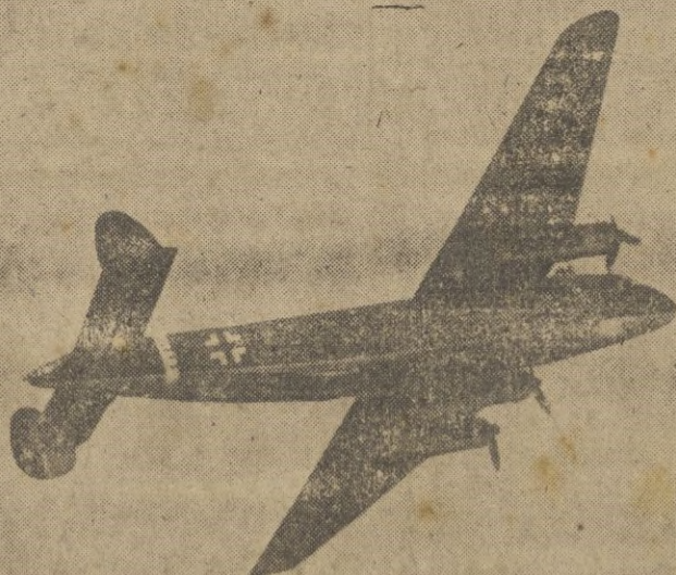
En pleno vuelo, por el espacio infinito, va el "Ju-90S" de cuatro motores, preparado para el combate mortal