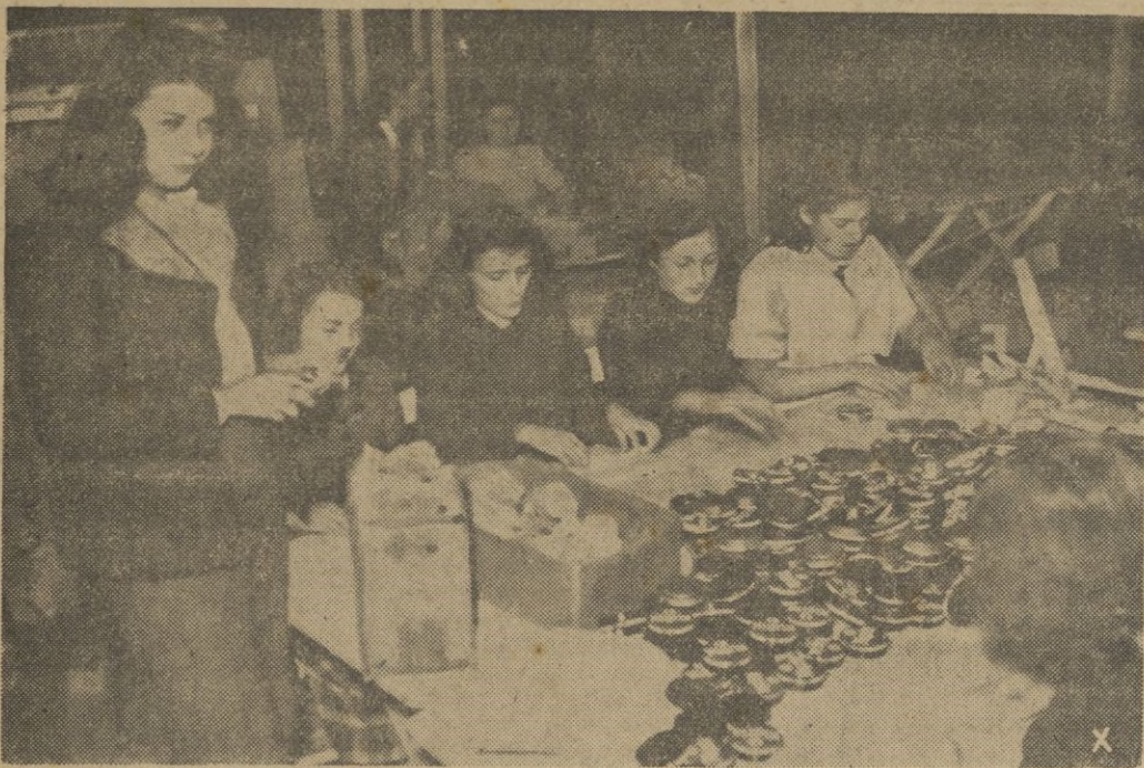
Las muchachas alemanas preparan cariñosamente los paquetes que luego han de llegar a los soldados del Este.