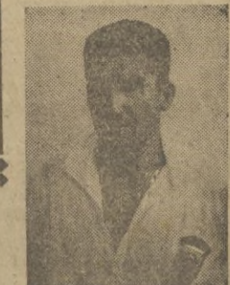
Melito y Melul, que esta tarde formarán la defensa ceutí frente al Murcia.