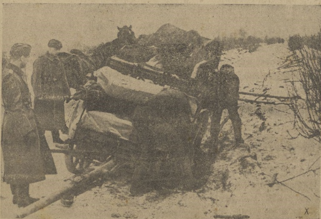
Al avanzar la columna falló la costra de hielo. El carro de guerra se ha hundido, pero no importa. Pronto será salvado el obstáculo y otra vez, como siempre, hacia adelante...