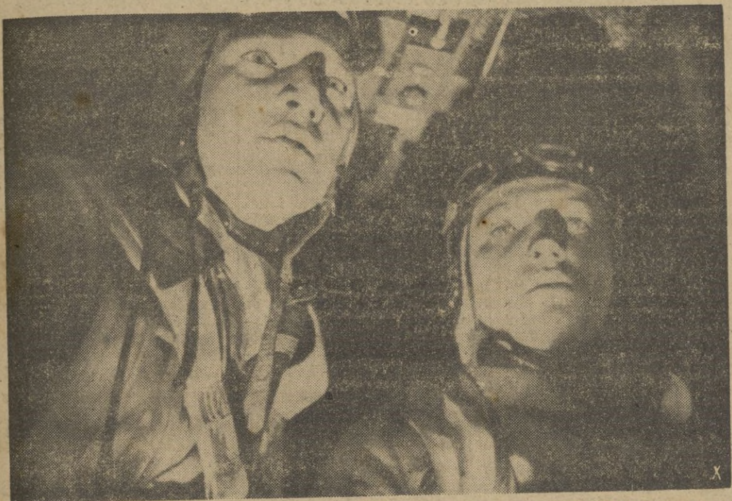
El avión, tipo "Do-117" vuela a gran altura. El piloto y el observador trabajan sin preocuparse de los haces de luz que llegan de abajo.

Una vez más se ha demostrado al mundo el temple de la raza