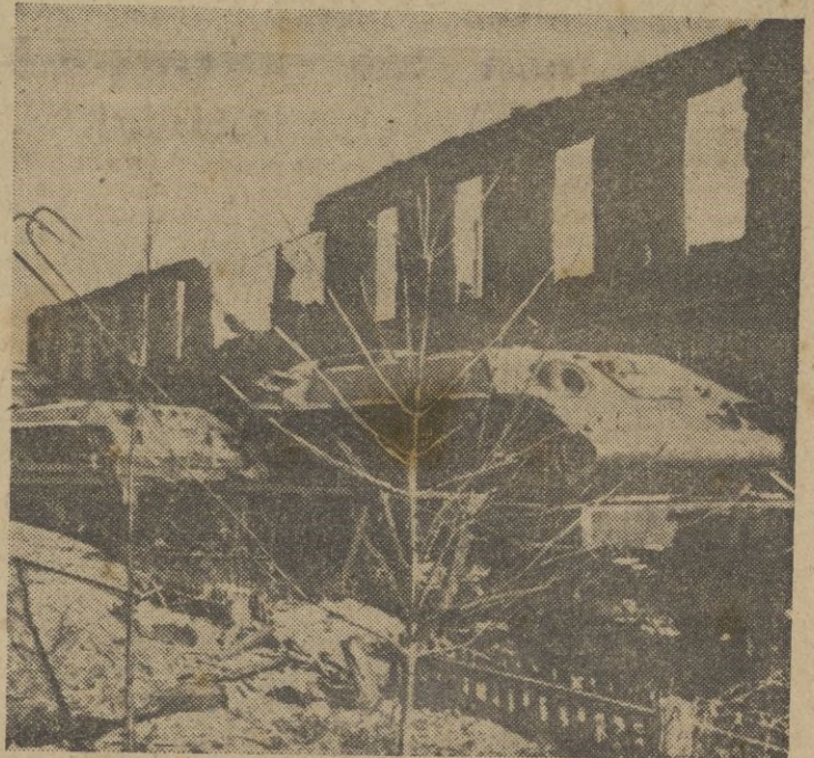
Chasis semi-confeccionados, de tanques sobre vagonetas, delante de una sala destruida por el fuego.