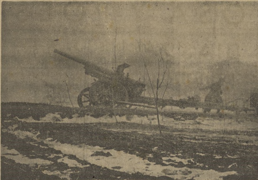
La artillería alemana bate fuertemente el objetivo que pronto caerá ..