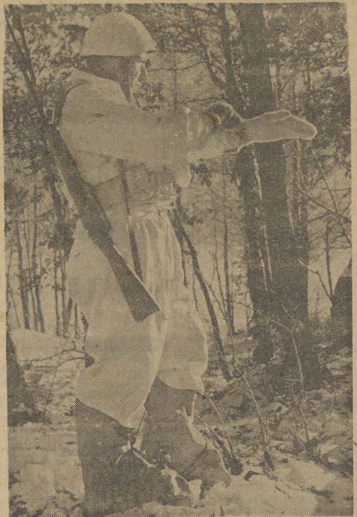
Un centinela con el equipo de invierno, en permanente vigilia cara al enemigo, insensible al frío ..