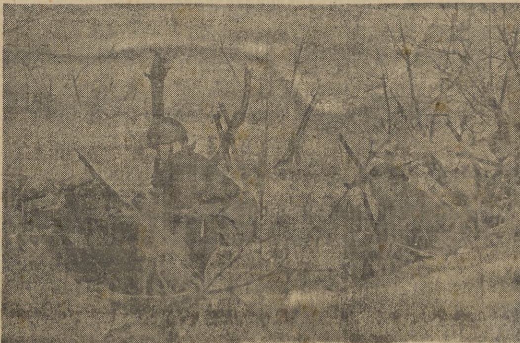
Hundidos en la zanja, los soldados alemanes esperan el momento de volver a entrar en acción.