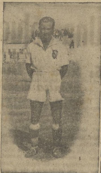
El mejor goleador del tercer grupo

Terminada la fase preliminar del torneo de Segunda División, damos a nuestros lectores la clasificación general de los goleadores del Tercer Grupo, la cual queda establecida en la siguiente forma: