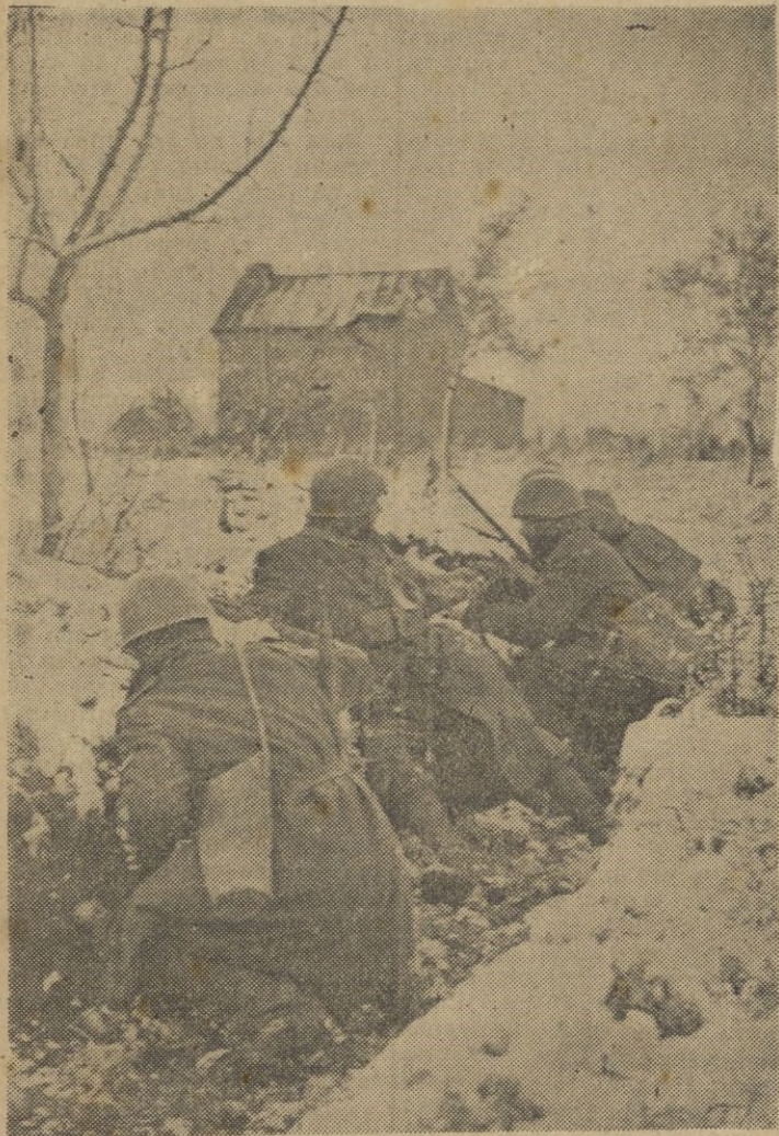
Los rusos ya se retiran después de un asalto infructuoso. Es el momento de que las avanzadillas italianas se lancen al ataque tras el enemigo que huye