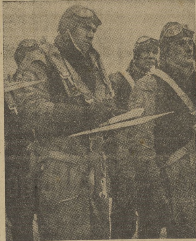
La dotación del bombardero atiende a las instrucciones del jefe, para el nuevo vuelo, esta vez sobre Africa.

Londres, 14. A pesar de seguir reinando la confusión política, en el Africa francesa del Norte, y a pesar de no haber tomado todavía una decisión los generales Giraud y De Gaulle, acerca de la celebración de una entrevista de ambos — escribe el corresponsal diplomático de la agencia Reuter — los Gobiernos de Londres y Washington estudian el problema de unión de los franceses de Ultramar con el fin de ayudarles a hallar la solución más satisfactoria. La declaración de Roosevelt hecha el 17 de noviembre, se-