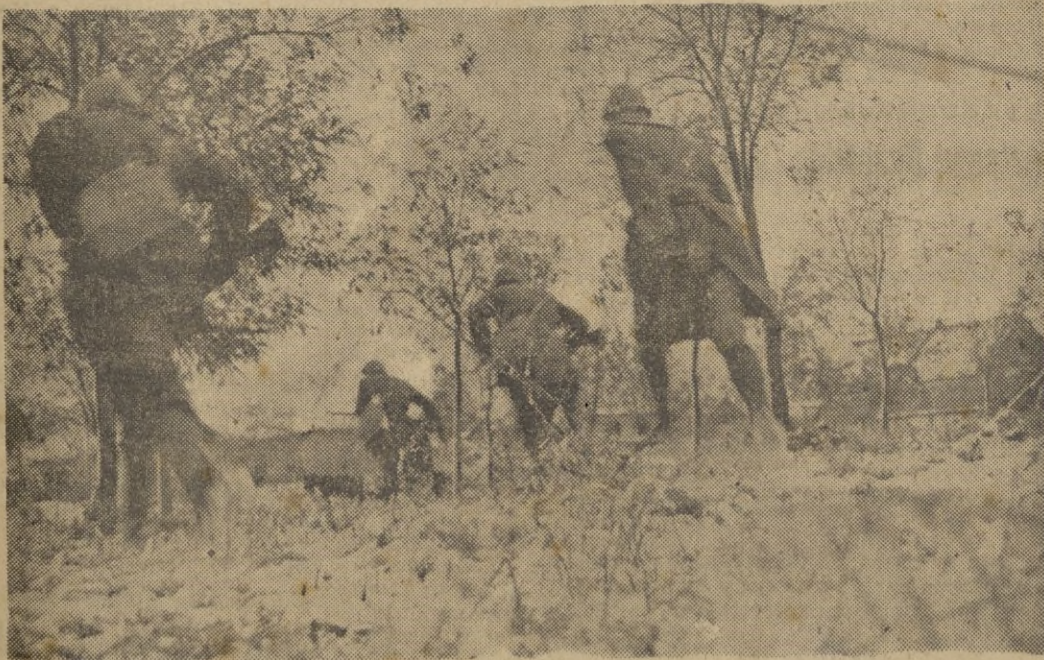
Conquistado el pueblo, las patrullas de vanguardia se lanzan a ultimar la operación, con la limpieza del terreno.