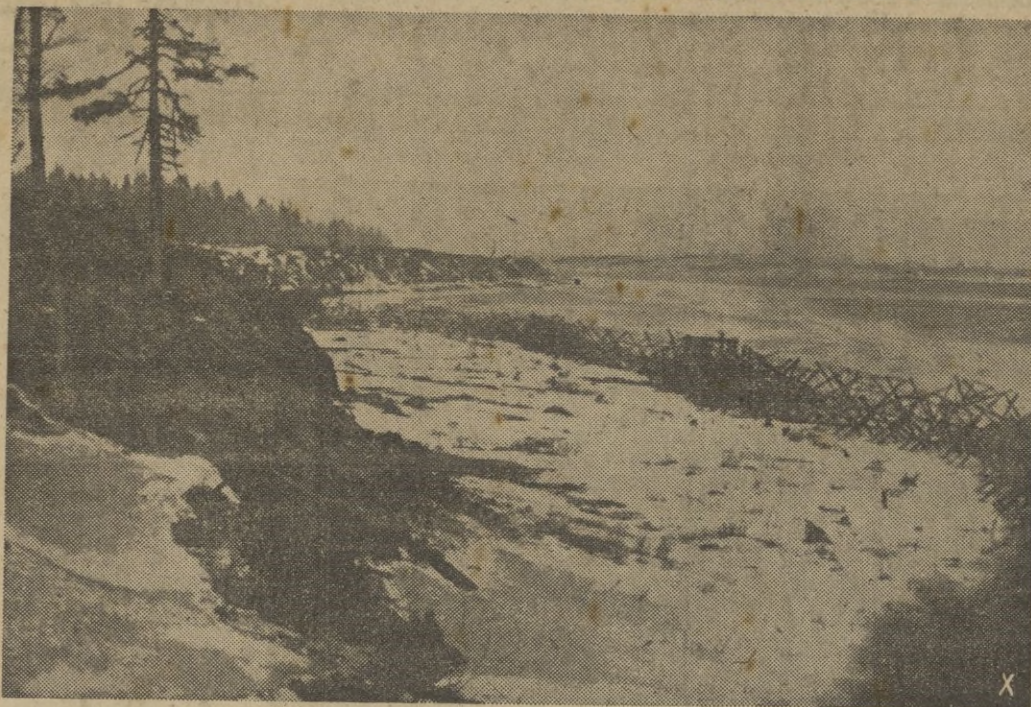
A la orilla del Neva, las posiciones alemanas son ahora un fuerte baluarte contra el enemigo. Cuando el hielo sea más grueso, el enemigo intentará pasar a la otra orilla. Los soldados alemanes están preparados.