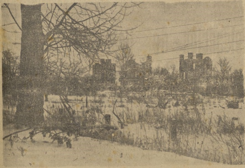
Los suburbios de la antigua capital son teatro de combates violentos