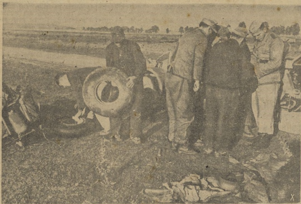
En los caminos de la guerra una avería no tiene importancia. Automáticamente es reparada para seguir el avance.