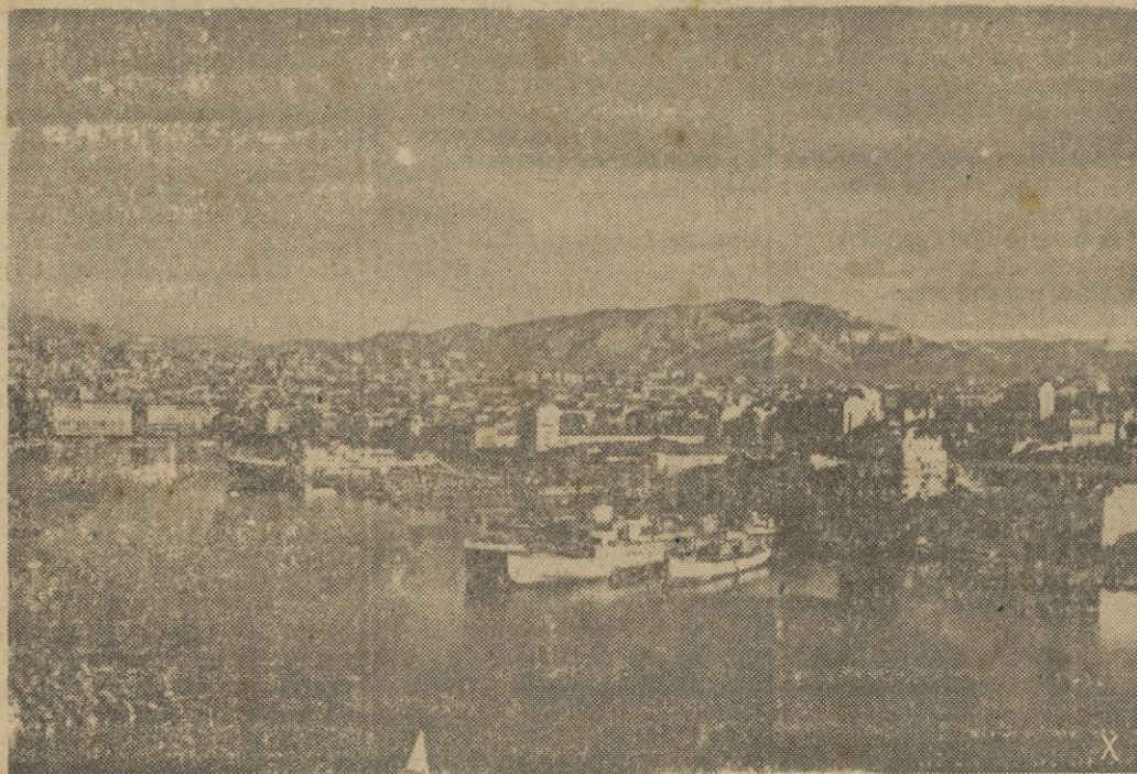
Después de la entrada de las tropas en Mars-Ha. Una vista del puerto.