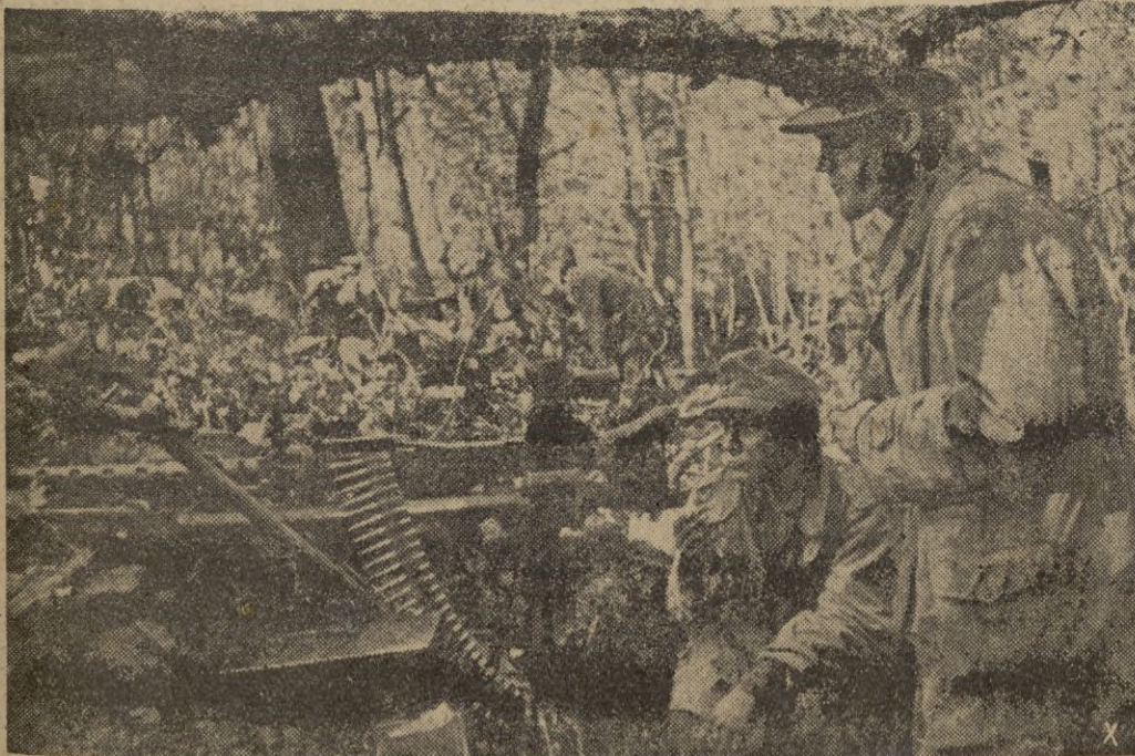
De noche, los ataques bolcheviques son continuos. Y de día hay que ejercer también una gran vigilancia, pues los soviets están a una distancia de 50 a 80 metros y la vista no alcanza más allá de los 30 metros, en la maleza del bosque