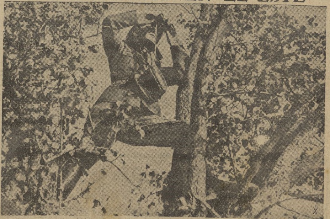
Un observador de la artillería controla los efectos de los tiros en el bosque