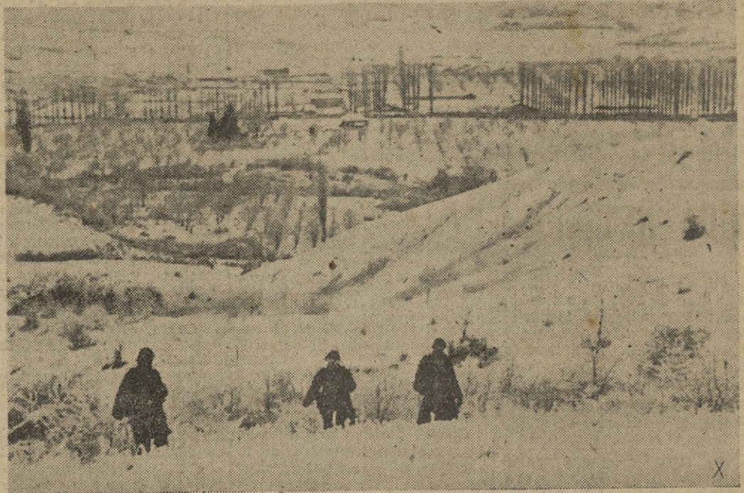
Una patrulla de observación avanza con cautela por territorio desconocido siempre preparados para cualquier sorpresa...