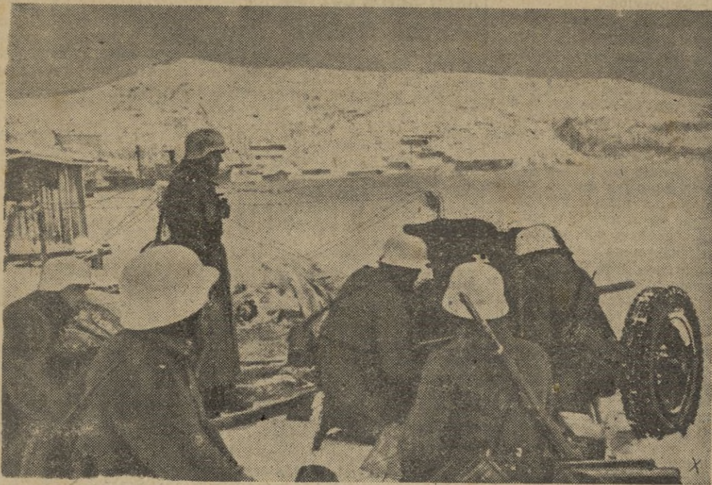
A pesar del tremendo frío los soldados alemanes están siempre en guardia para rechazar los ataques del enemigo. La artillería antitanque, emplazada, protege el puerto frente al mar polar

mundo que nuestra actitud política ha cambiado de poco tiempo a esta parte, considerándonos inmunes de los riesgos que nos rodean, ya que este sería un criterio de avestruz, y creyendo que quedaríamos aislados de la lucra y vicisitudes porque atraviesa el mundo, vendríamos a lo peor que es el abdicar en nuestra misión que tenemos que cumplir en lo universal, misión que Dios tuvo a bien concedernos. Falange — agrega Mora Figueroa —, que tuvo su razón de existencia, primeramente para la salvación de España, hoy y mañana seguirá viviendo y luchando por su engrandecimiento.