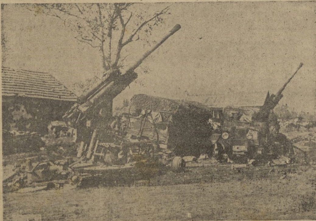
Artillería antiaérea rusa destruida por la aviación germana.