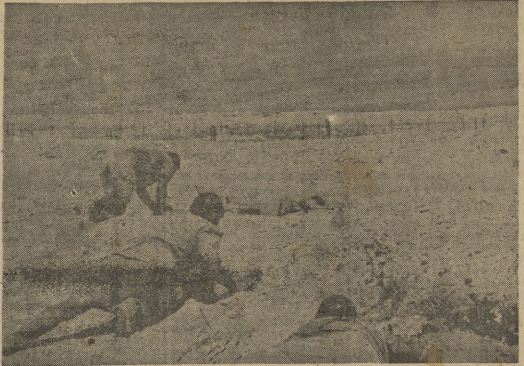
Las tropas italianas se disponen a un asalto