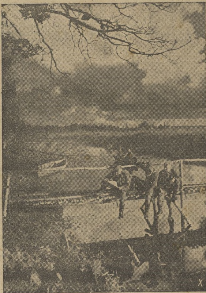
Los soldados descansan de los duros combates librados durante todo el día.