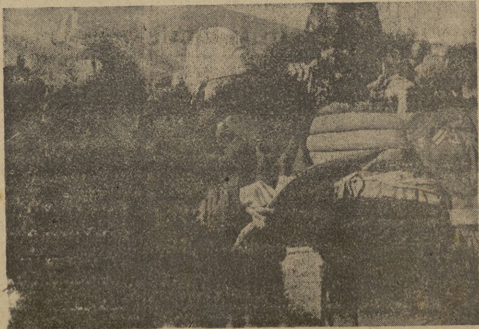
Un piloto regresa a su base después de una prolongada travesía de guerra.