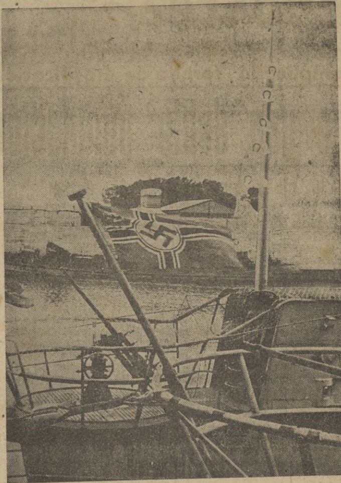
En el periscopio ondean gallardetes cada uno de los cuales significa un barco hundido