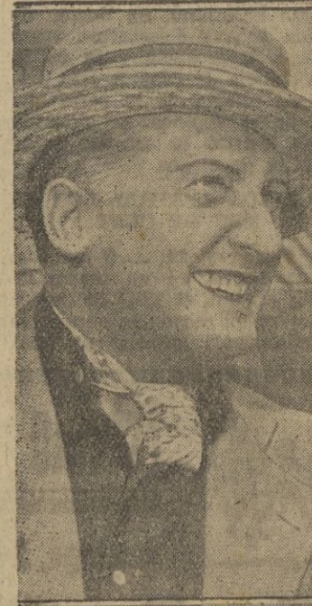
Hans Aibers, artista alemán de gran temperamento, que últimamente hemos visto actuar en la película "Corazón de fuego", proyectada en el cine Apolo