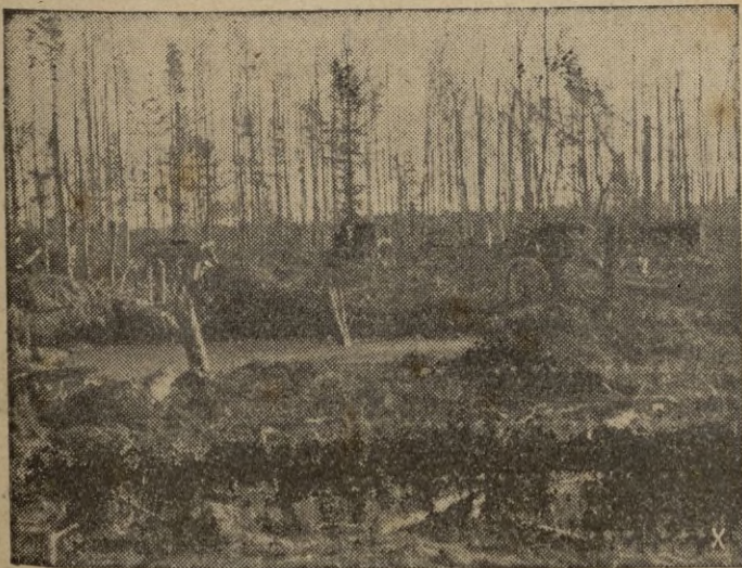
Las bombas de la aviación alemana dejaron esta posición soviética artillera en un estado deplorable