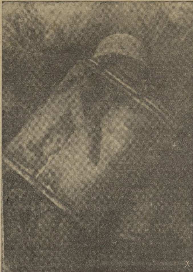
Tres veces al día hay que llevar el rancho a los camaradas de las primeras líneas, a través de trincheras expuestas al fuego bochevique