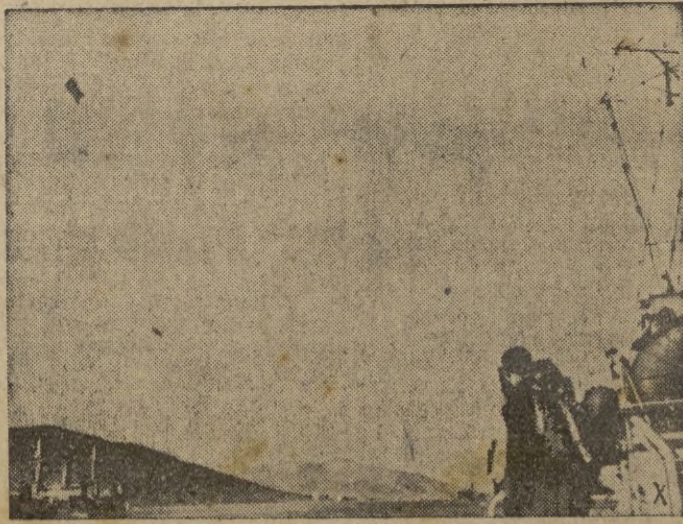
Un convoy alemán entra en la zona de seguridad de su puerto de destino