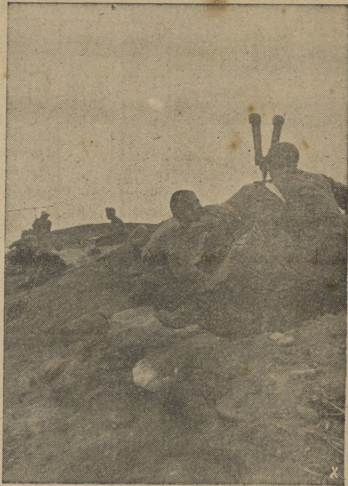
Oficiales alemanes y rumanos dirigen el fuego de las artillerías unidas, desde un alto de la montaña caucásica

De estas operaciones no regresaron tres de nuestros aviones. — EFE.