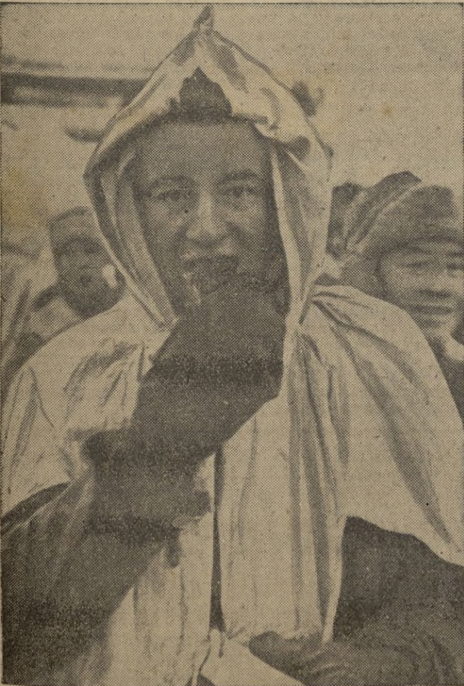
Los soldados alemanes prueban frituras de pescado, preparadas por enfermeras.