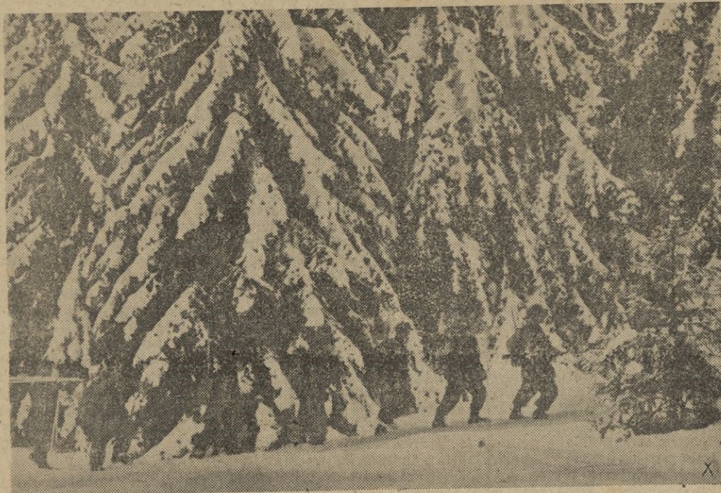
Las fuertes nevadas han cubierto de blanco los bosques de abetos, dificultando la marcha

El imperio de la verdad y el reinado de la bien es el ideal de la España auténtica. Con él vencimos al arrabismo en Nicea obtuvimos la victoria en Granada y en Lepanto, nos coronamos de gloria en América y Oceanía; impugnamos a Lutero; llevamos la voz cantante en Trento; surgimos victoriosos el dos de mayo y desenmascaramos al marxismo. Tales son los frutos de la predicación de Apóstol Santiago.