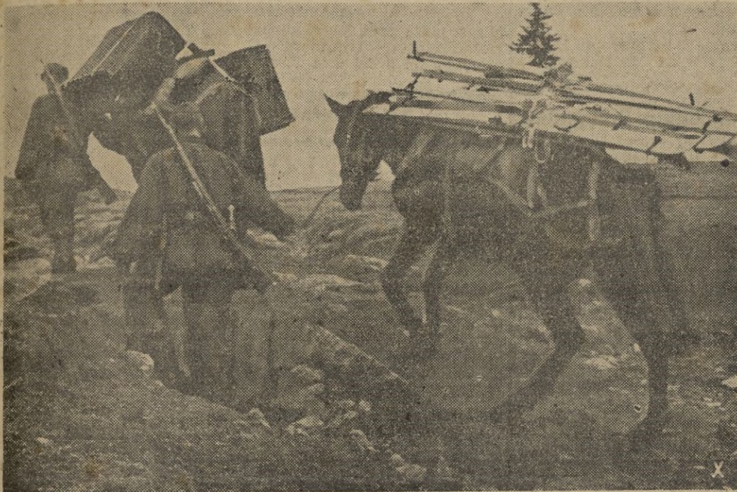
Con cargas pesadas suben por las rocas las columnas que transportan esquís, que son necesarios en el punto de apoyo de la división, en la alta montaña. Pero los costos ¿qué contienen? ¿Municiones?

Cazadores de Montaña de la S. S. militar, en las rocas