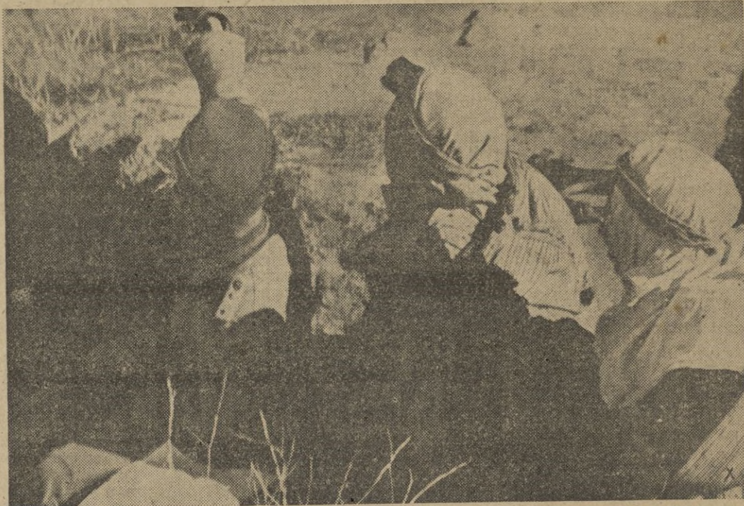
Han sido observados muchos tanques enemigos. Los indígenas ayudan al jefe de las tropas en la exploración del terreno. . .