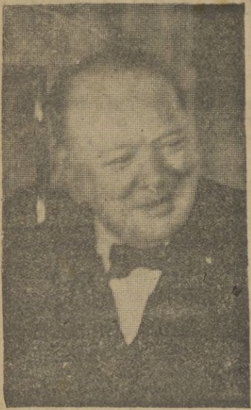
(Viene de la primera)

Africa septentrional, en el pasado noviembre.