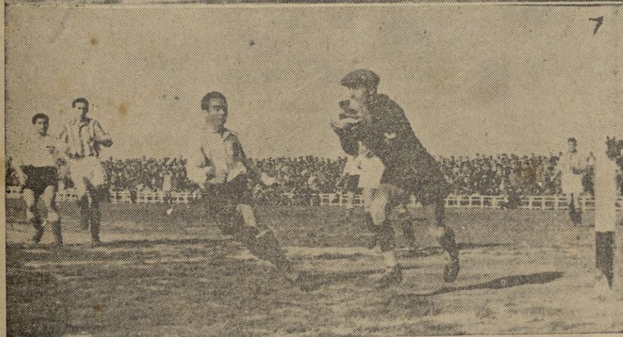
1 y 2. - Los equipos del Ceuta y Real Sociedad de San Sebastián, antes de comenzar el encuentro.--3.-Saludo de los capitanes ante el árbitro señor Ocaña. -- 4.-Un centro de Morla lo pretende rematar Abad, impidiéndolo la ágil salida de Chillida. -- 5.-Otra gran intervención del meta donostiarra, protegido por su defensa. -- 6.-El único gol del partido. El balón, impulsado por Melul, ha dado en un lateral y ha llegado a las mallas, ante la sorpresa de Chillida. -- 7.-El centro de Abad lo intercepta Chillida, acosado por Arnau. -- (Fotos: Cabrera Guadarrama.)