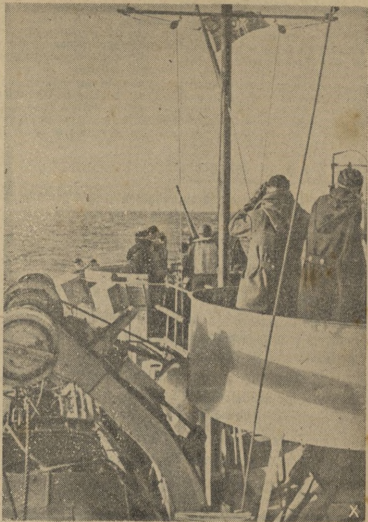
Suena la voz de alarma, y los artilleros se preparan para hacer fuego contra los aviones soviéticos

En ciertos círculos del Vaticano se dice que no tendrá lugar el acto tradicional en la Basílica de San Pedro. — EFE.