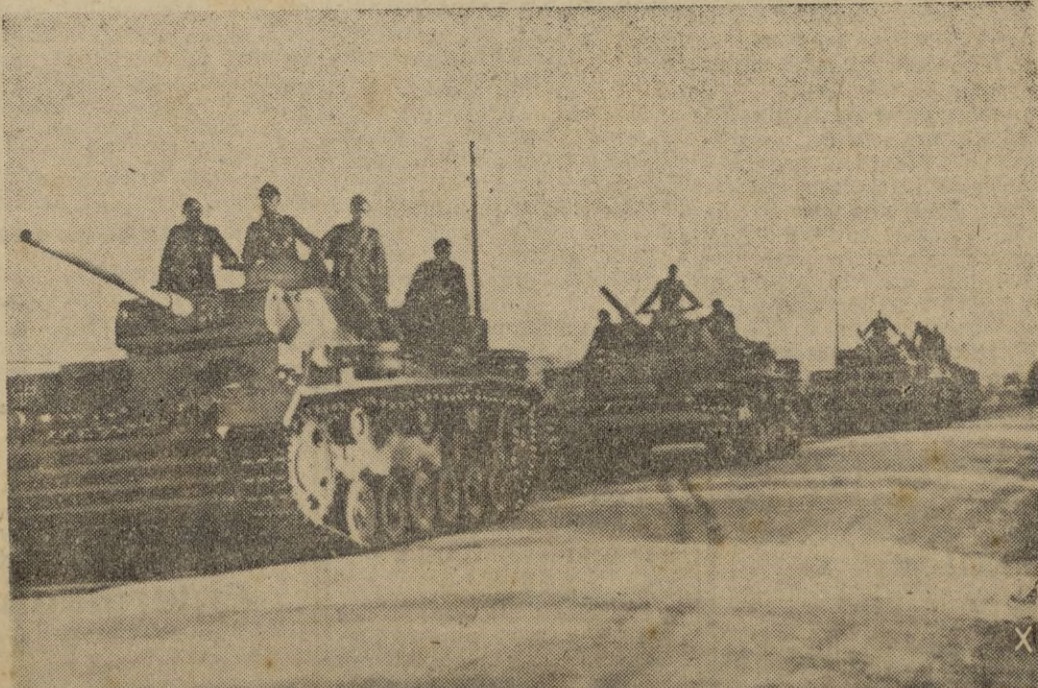
Los tanques, ya preparados, solo esperan la orden del mando, para emprender la marcha hacia Túnez

desplazamiento total de 408.000 toneladas.