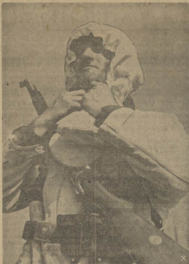
Las unidades de asalto se camuflan con los ropajes de invierno para disimular sus movimientos sobre las superficies nevadas.