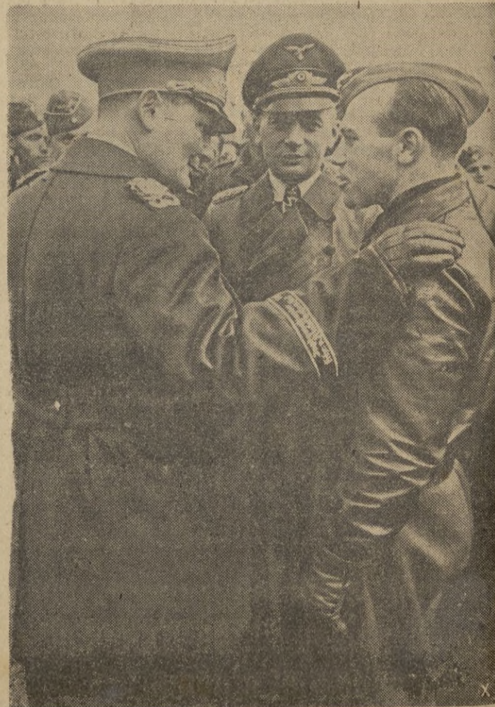
Hermann Goering habla con sus aviadores de caza