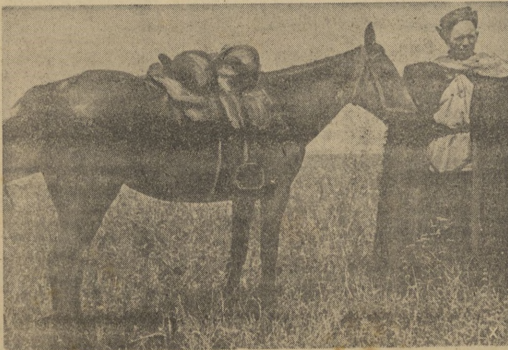
Un pastor de caballos de la tribu de los Kabardinos llega para saludar a los primeros soldados alemanes. Su traje nacional es la "Burka", la capa negra y el "Baschlyk", el pañuelo blanco de cabeza