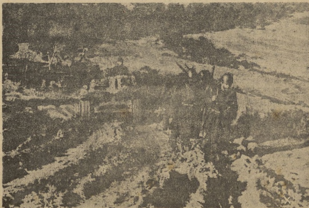
Por los terrenos del frente tunecino, la infantería italiana sigue a los tanques alemanes, protegiendo su avance