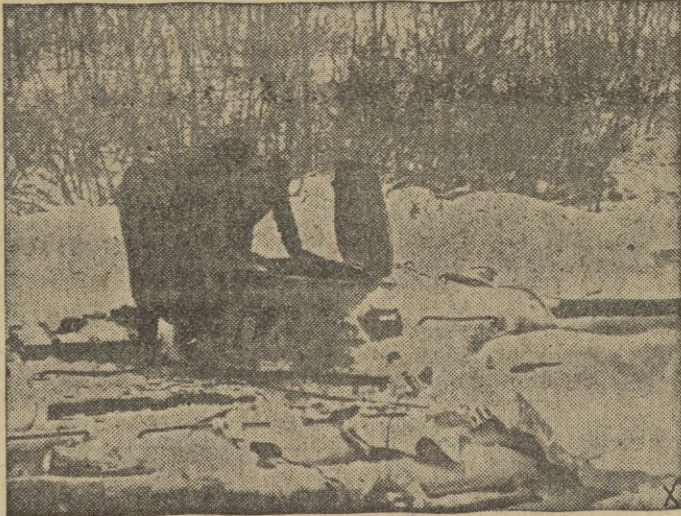
Soldados alemanes registran uno de los muchos tanques soviéticos aniquilados