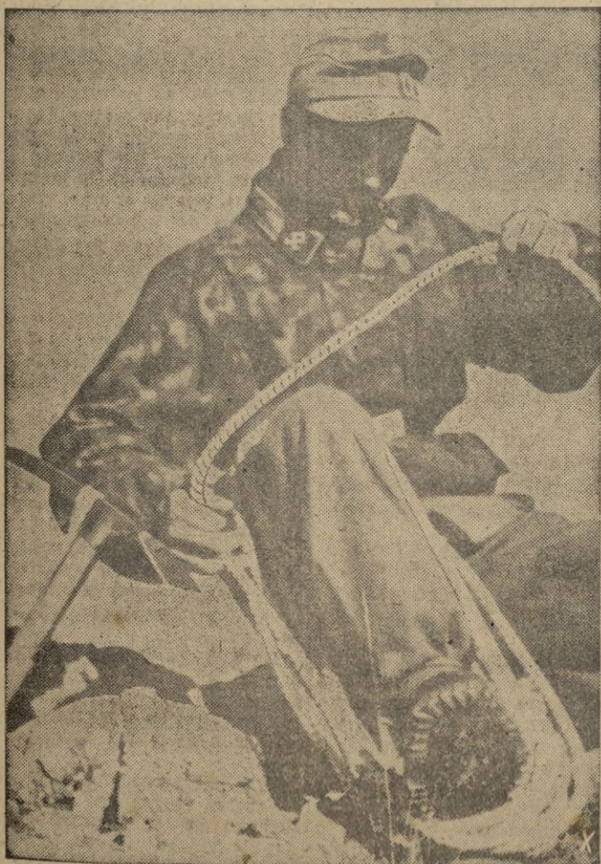
El cazador albino enrosca cuidadosamente la cuerda que le sirvió para escalar la abrupta montaña

legrino, otro cerca de Finalo y el último cerca de Caprini.