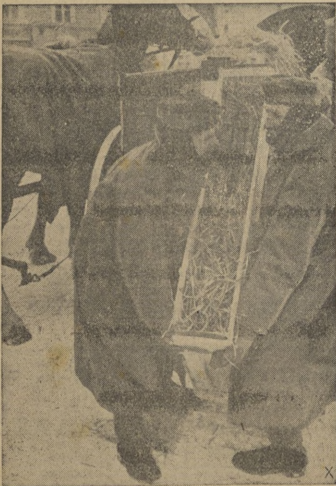
Dos soldados alemanes transportan nada menos que unos cristales que van a modernizar la construcción del refugio.

Grandes almacenes de tejidos Casa Ibañez La casa mas surtida Últimas novedades