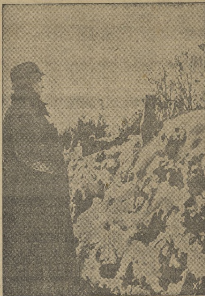
El soldado europeo sigue vigilando por la seguridad del continente en medio del duro ambiente hostil