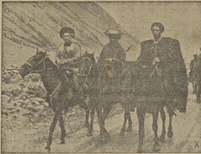
Pastores de las montañas caucásicas colaboran como voluntarios con las fuerzas anticomunistas prestando valiosos servicios de orientación